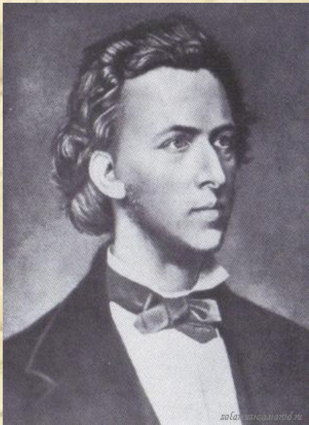
Фредерик Шопен 1810 – 1849

Оба они были прекрасными пианистами. Шопен завоевал признание слушателей в светских салонах, а Лист – в больших концертных залах.