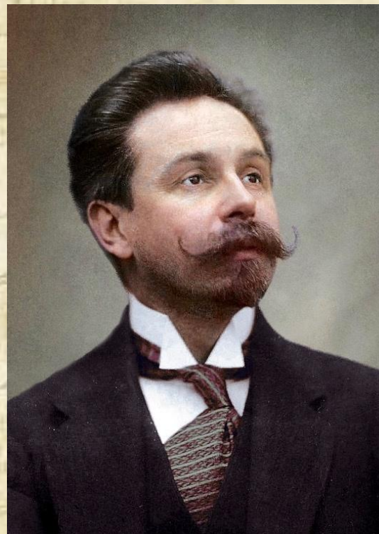
А.Н.Скрябин 1872 - 1915