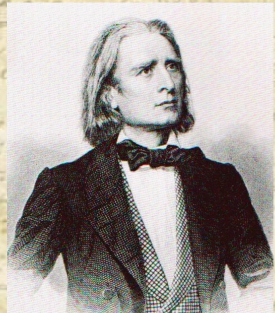
Ференц Лист 1811 – 1886