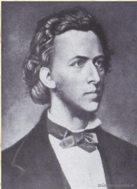
Фредерик Шопен 1810 – 1849

Оба они были прекрасными пианистами. Шопен завоевал признание слушателей в светских салонах, а Лист – в больших концертных залах.