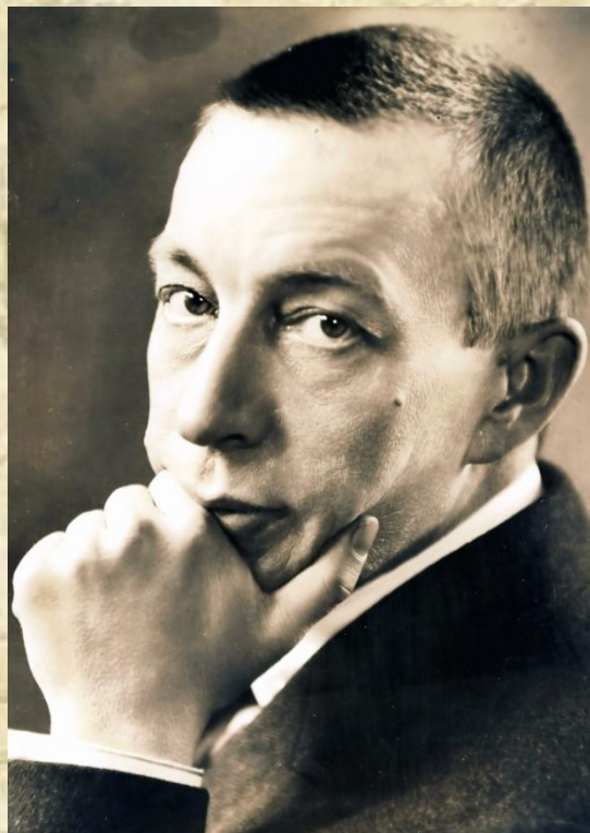
С.В.Рахманинов 1873 – 1943

Значительным достижением в развитии жанра являются этюды русских композиторов.