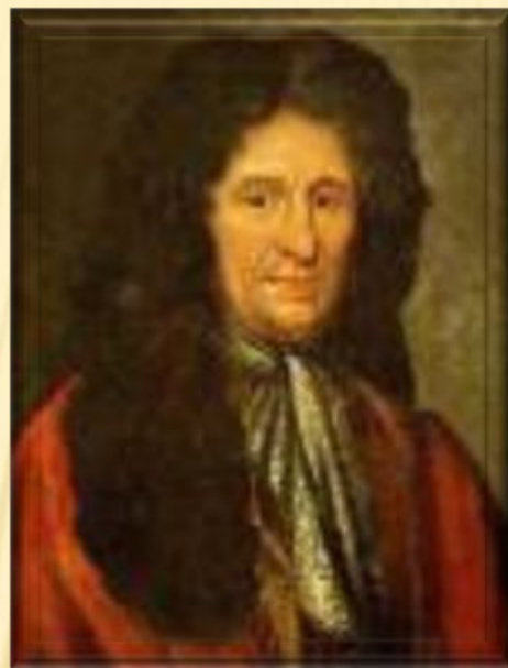
Жан де Лафонтен