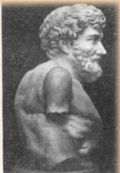
Эзоп — горбатый мудрец. Мрамор. VI в. до н. э. Вилла Альбани

Голодная лисица увидела виноградную лозу со свисающими гроздьями и хотела до них добраться, да не смогла; и, уходя прочь, сказала сама себе: «Они ещё зелёные!»