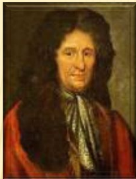
Жан де Лафонтен