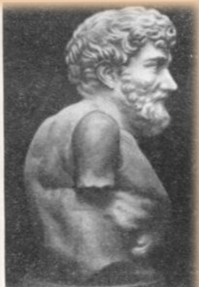
Эзоп — горбатый мудрец. Мрамор. VI в. до н. э. Вилла Альбани

Голодная лисица увидела виноградную лозу со свисающими гроздьями и хотела до них добраться, да не смогла; и, уходя прочь, сказала сама себе: «Они ещё зелёные!»