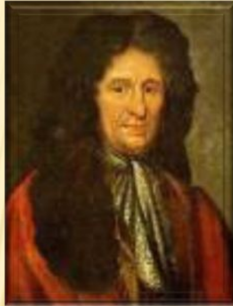
Жан де Лафонтен