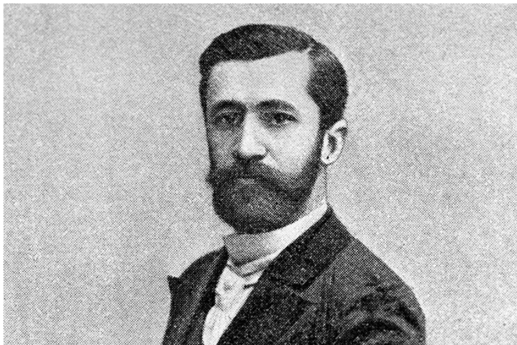
Основоположник Дмитрий Сергеевич Мережковский