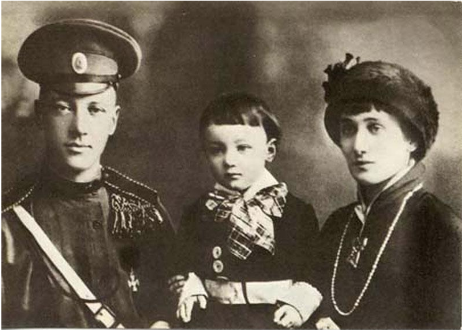
Н.С.Гумилев, Лев Гумилев, А.А.Ахматова. Царское Село. 1916г.