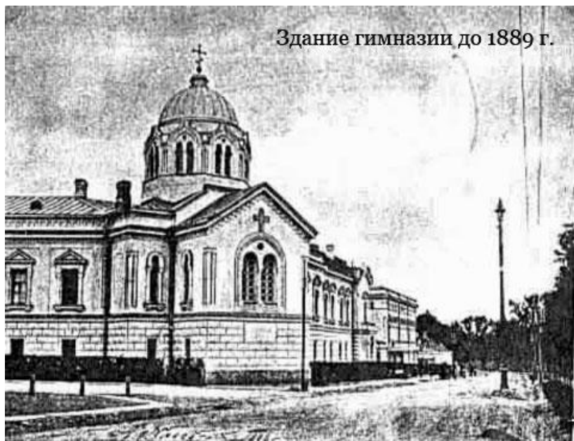
Здание гимназии до 1889 г.