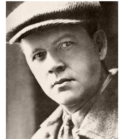
В.Маяковский В.Хлебников В.Каменский