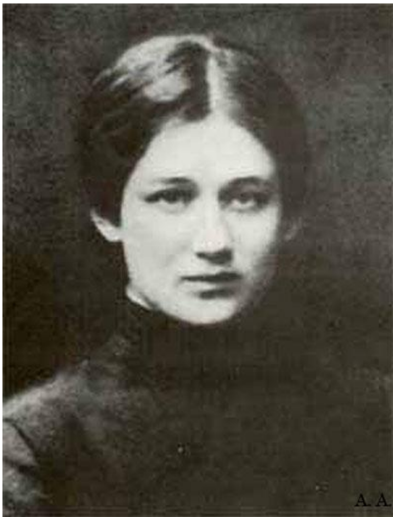
А. А. Ахматова.