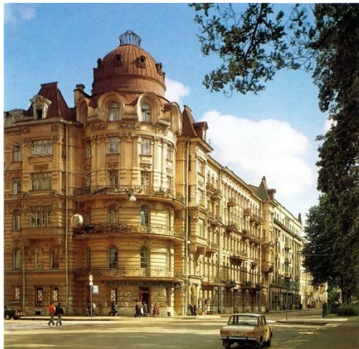
«Башня» Вячеслава Иванова

Акмеизм (от греч. акме — «высшая степень, вершина, цветение, цветущая пора») — литературное течение, противостоящее символизму и возникшее в начале XX в. в России. Акмеисты провозглашали материальность, предметность тематики и образов, точность слова.