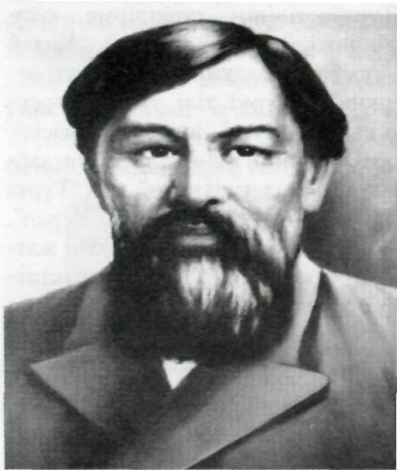
“Ы. Алтынсарин”. Суретші Ә.Бұқарбаев

Қостанай облысы, Затобол ауданында туған.