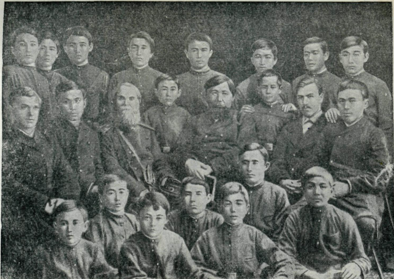
Алтынсарин мұғалімдермен бірге Торғайдағы қолөнер училищасы оқушыларының арасында