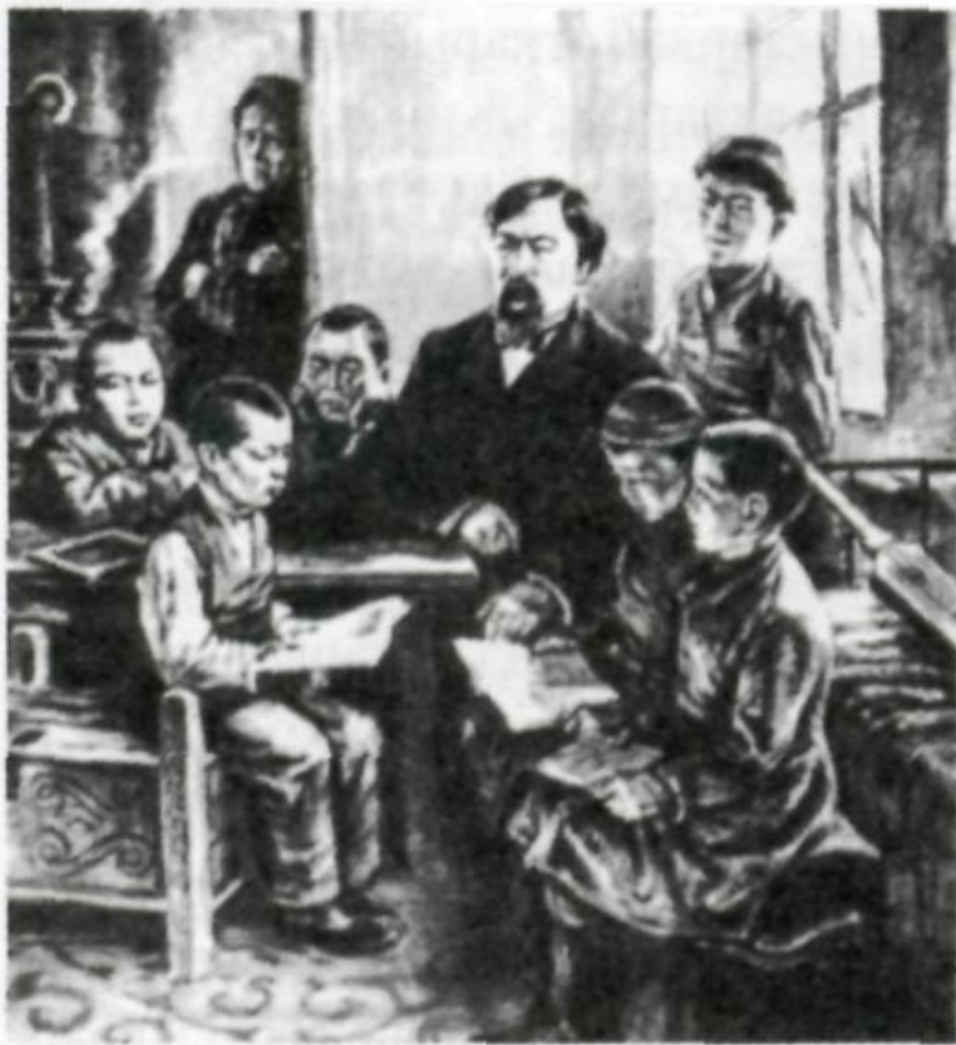
Ы. Алтынсарин шәкірттерімен

“Өзімнің оқушыларымды мен туысқанымдай көремін, біздің барлық ісіміз де, тілегіміз де материалдық күшіміз де бір, басқаша болуы мүмкін де емес”