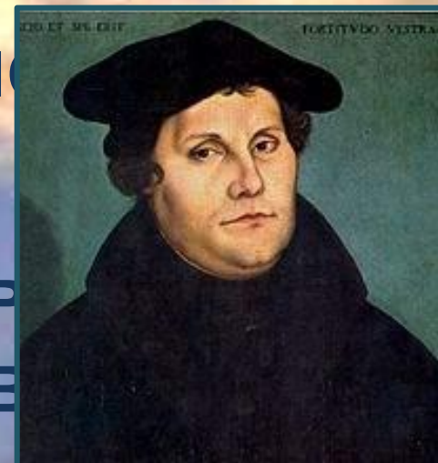
Мартин Лютер- инициатор Реформац ии, переводчик Библии на немецкий язык

привело к появлению третьих направлений в христианстве