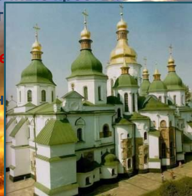
Софийский собор в Киеве, X

□ В отдельных случаях разводы допускаются