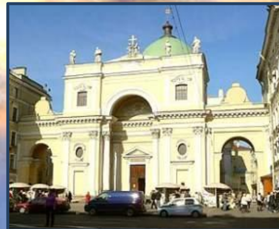
Базилика Святой Екатерины В Санкт-Петербурге

Глава архиепархии Матери Божьей и конференции католических епископов России Павел Пецци