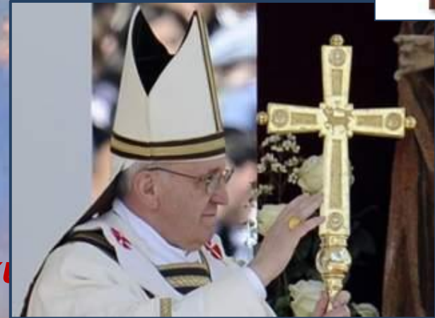
ПАПА РИМСКИЙ Франциск