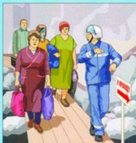
Эвакуация населения из опасных зон