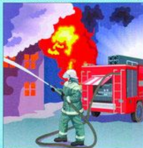
Локализация и тушение пожаров на маршрутах движения и участках (объектах) работ