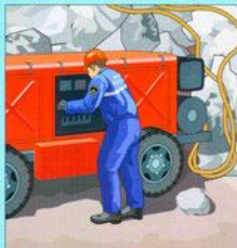
Подача воздуха в заваленные защитные сооружения с повреждёнными фильтровентиляционными системами