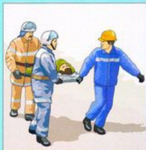
Оказание первой медицинской помощи поражённым и доставка их в лечебные учреждения