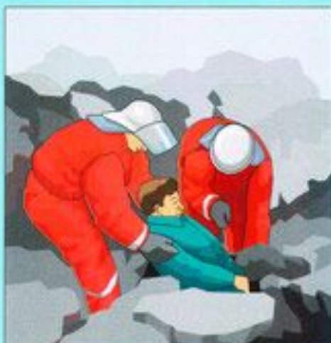
Розыск и извлечение пострадавших из-под завалов и других опасных мест