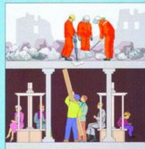
Вскрытие заваленных защитных сооружений и спасение находящихся в них людей