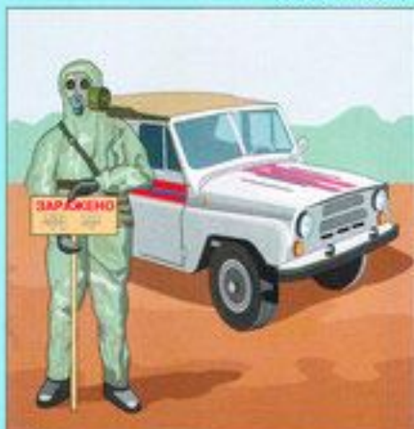
Разведка маршрутов выдвижения и участков (объектов) работ

Это действия по спасению людей, материальных и культурных ценностей, защите природной среды в зоне чрезвычайных ситуаций, локализация чрезвычайных ситуаций и сведение до минимума ущерба от них