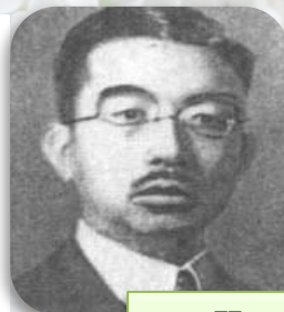
Император Японии Хирохито