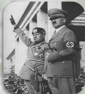
Гитлер и Муссолини