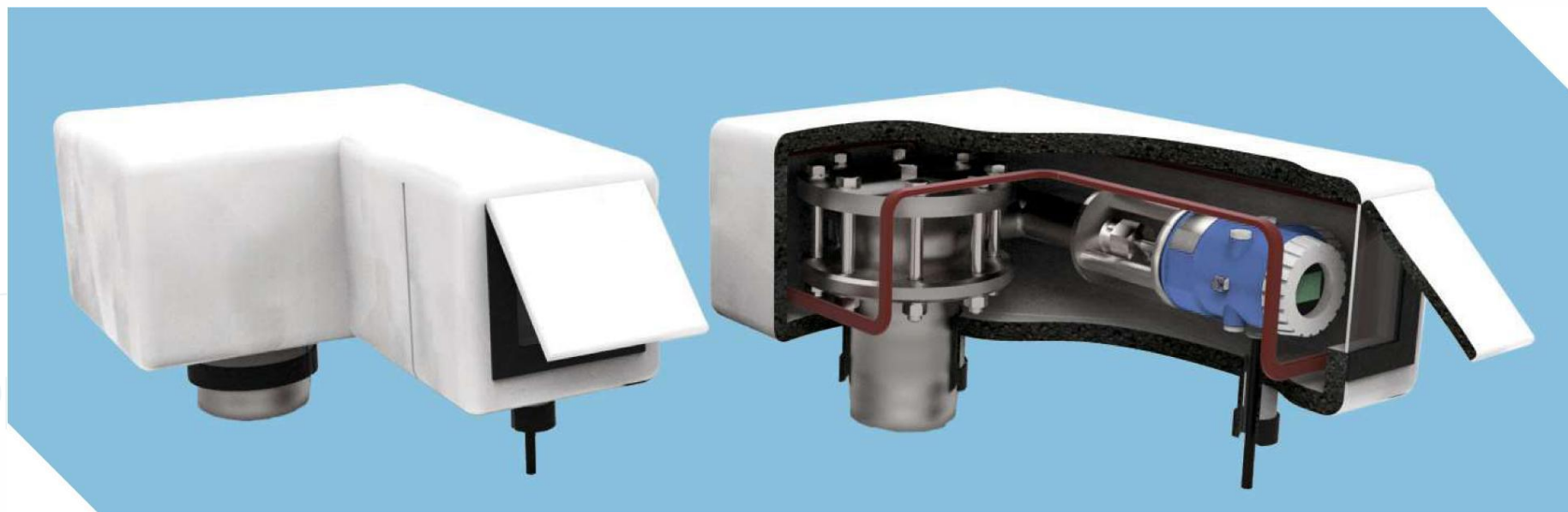
Термочехол РИЗУР для буйкового уровнемера