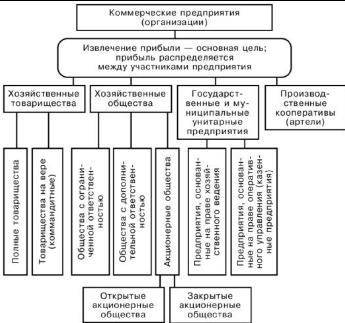
Рис. 3.2. Коммерческие организации