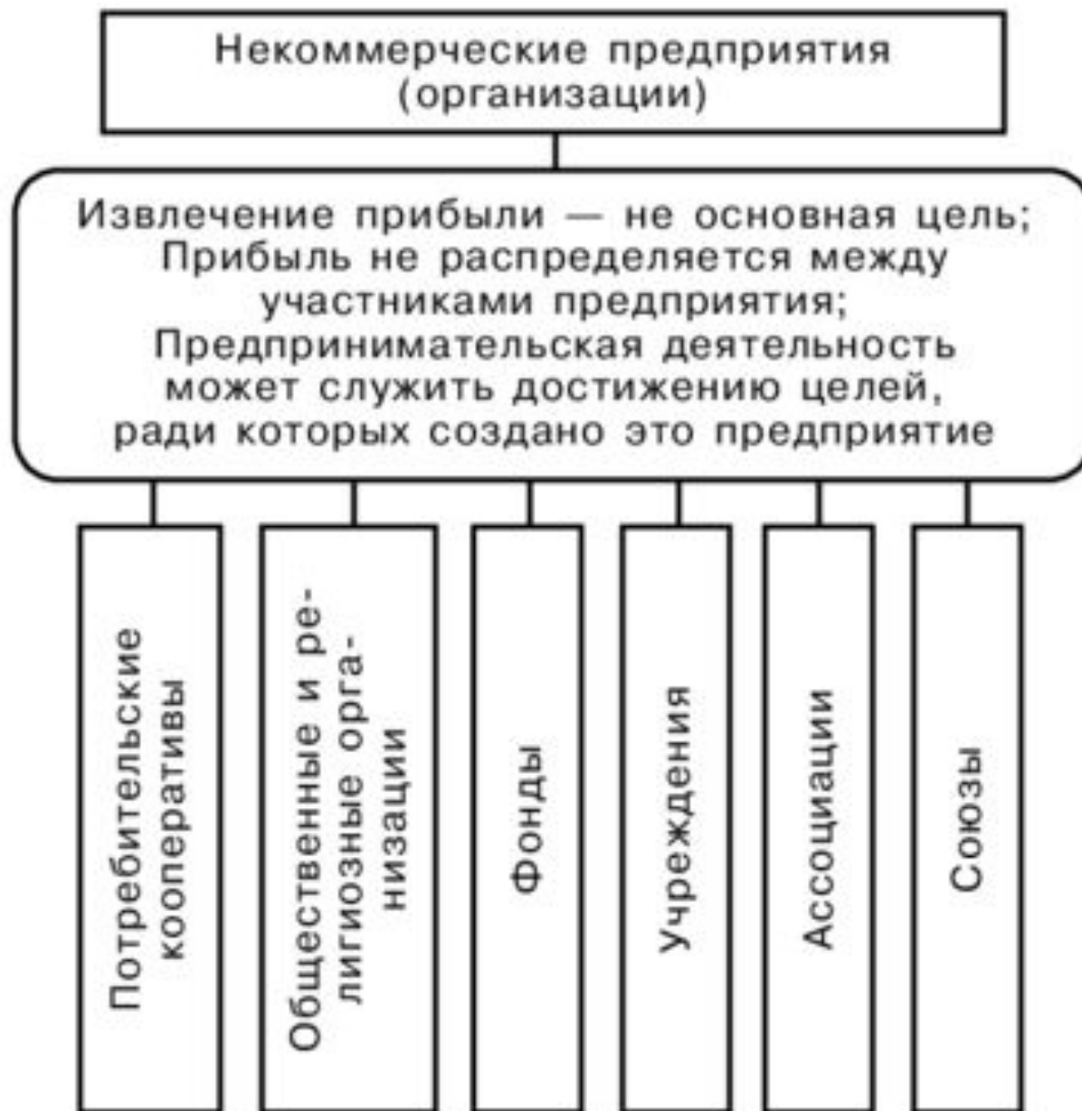
Рис. 3.3. Некоммерческие организации