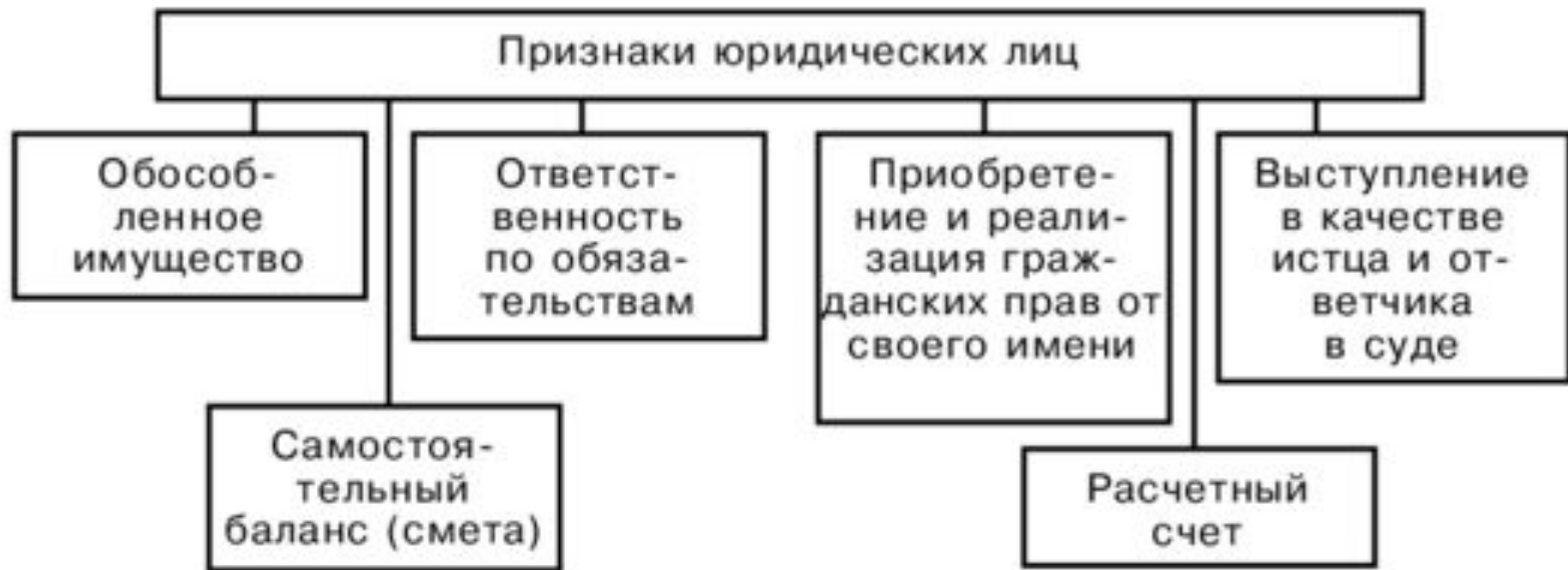
Рис. 3.1. Признаки юридических лиц