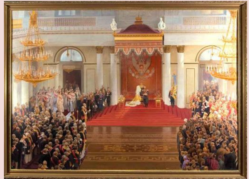
Поляков В. В. «Приём в Георгиевском зале Зимнего дворца по случаю открытия Первой Государственной Думы 27 апреля 1906 года», 1907