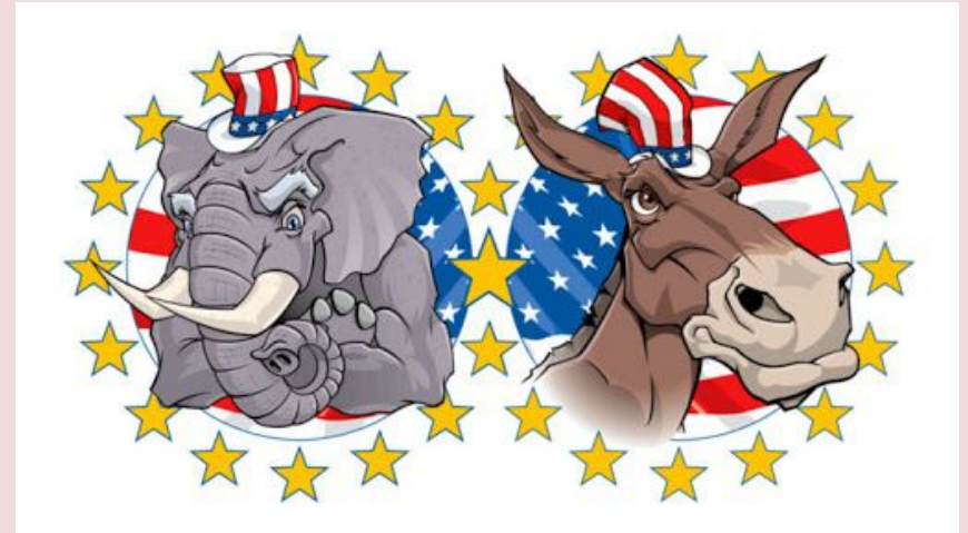
Символы Республиканской и Демократической партий США