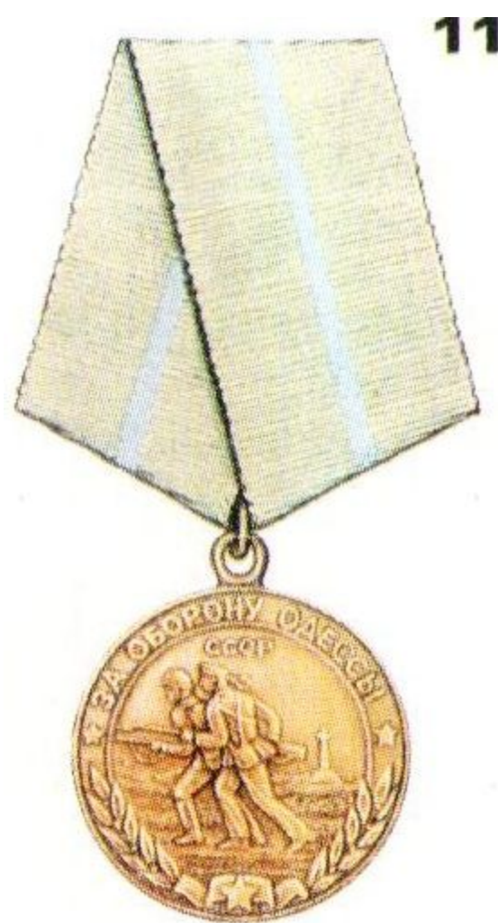
Медаль «За оборону Одессы»