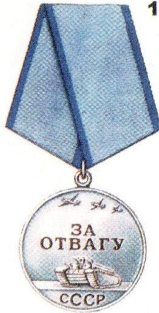
Медаль «За отвагу»