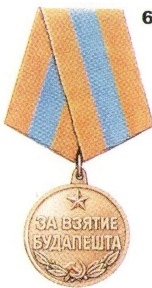
Медаль «За взятие Будапешта»