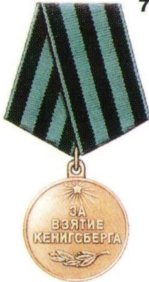
Медаль «За взятие Кенигсберга»