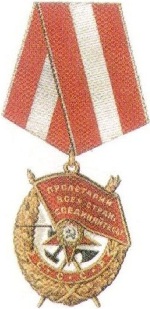
Орден Красного Знамени