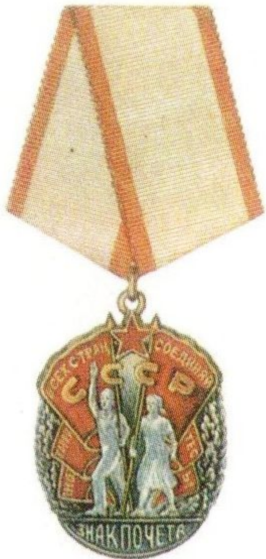
Орден «Знак почета»