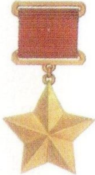
Медаль «Золотая звезда» Героя Советского союза