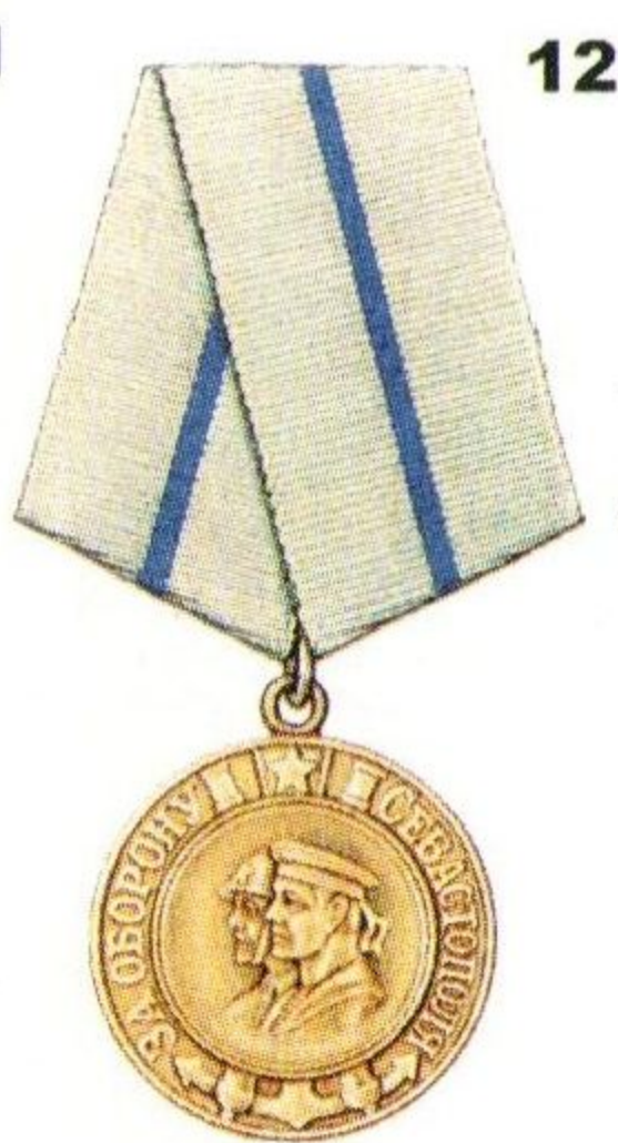
Медаль «За оборону Севастополя»