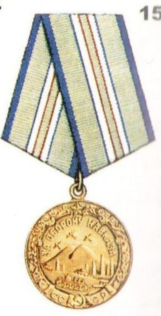
Медаль «За оборону Кавказа»