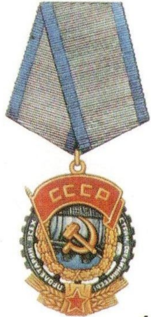
Орден Трудового Красного Знамени