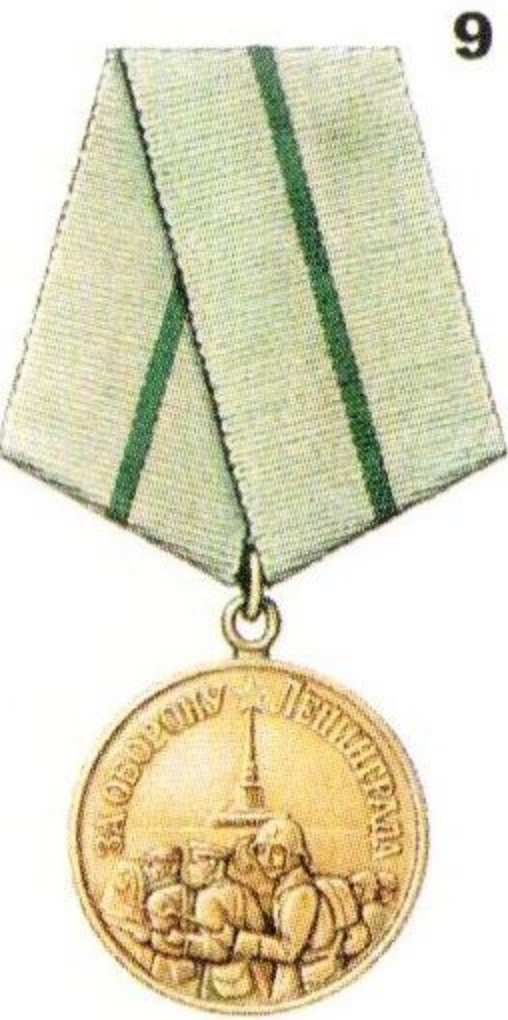
Медаль «За оборону Ленинграда»