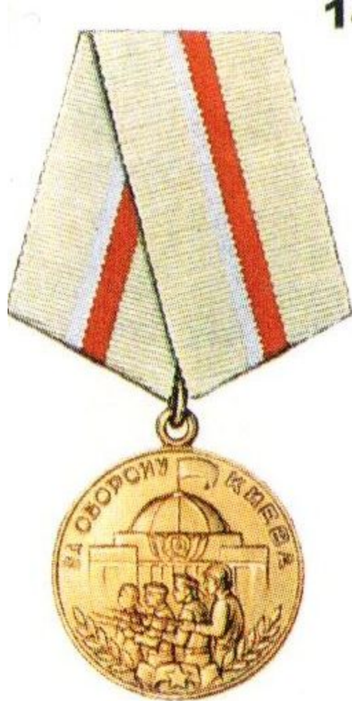
Медаль «За оборону Киева»