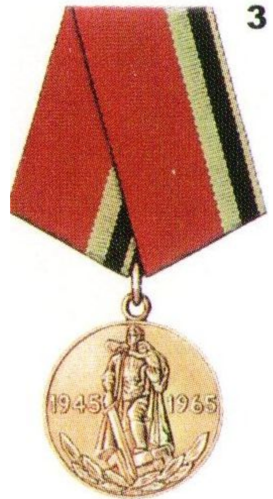
Медаль «Двадцать лет победы в Великой Отечественной войне 1941-1945 г.»