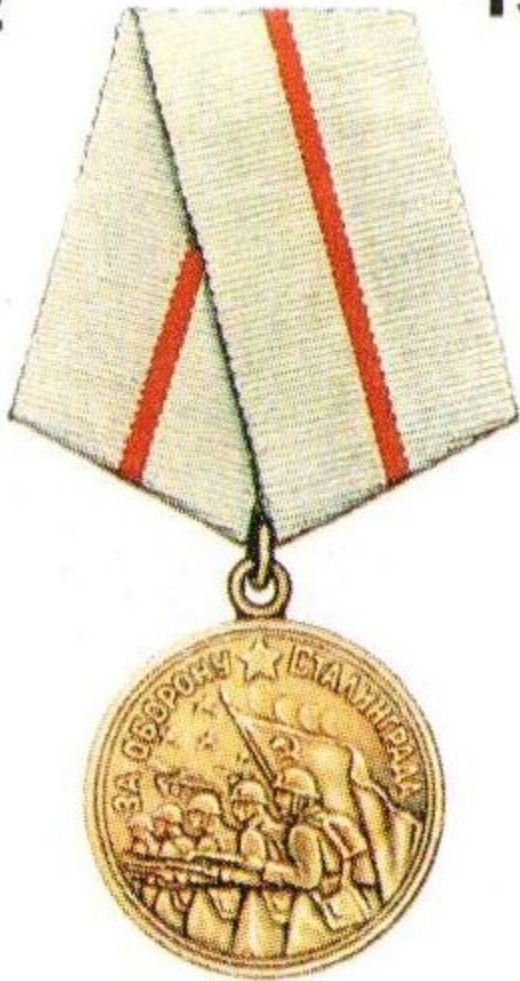
Медаль «За оборону Сталинграда»