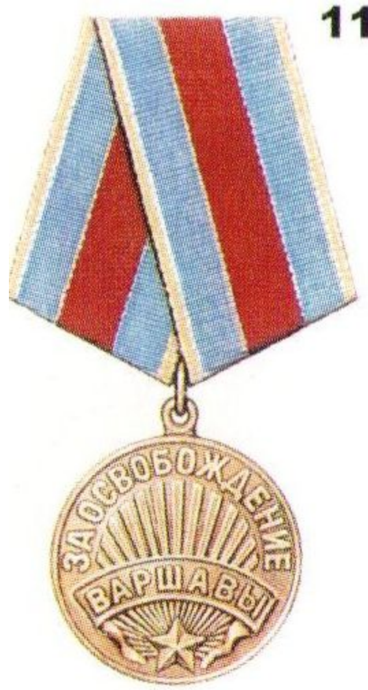
Медаль «За освобождение Варшавы»