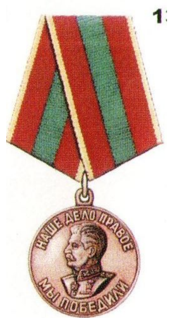
Медаль «За доблестный труд в Великой Отечественной войне 1941 – 1945 гг.»