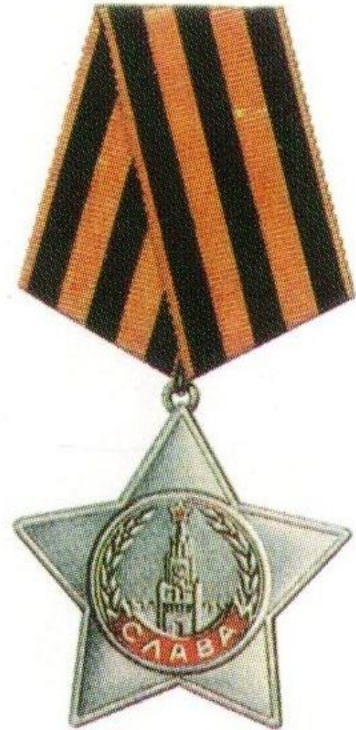
Орден Славы 1, 2 и 3 степени