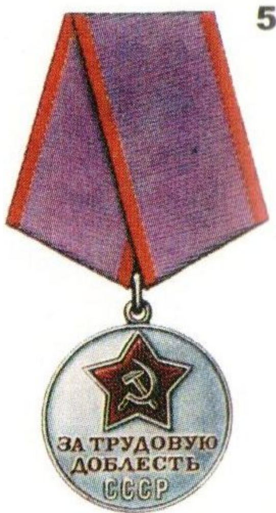
Медаль «За трудовую доблесть»