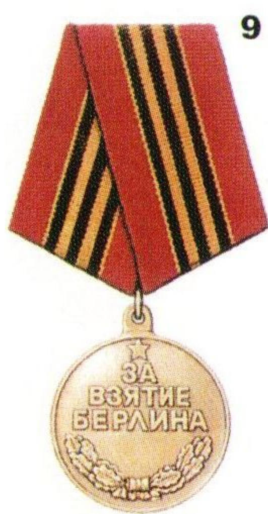
Медаль «За взятие Берлина»