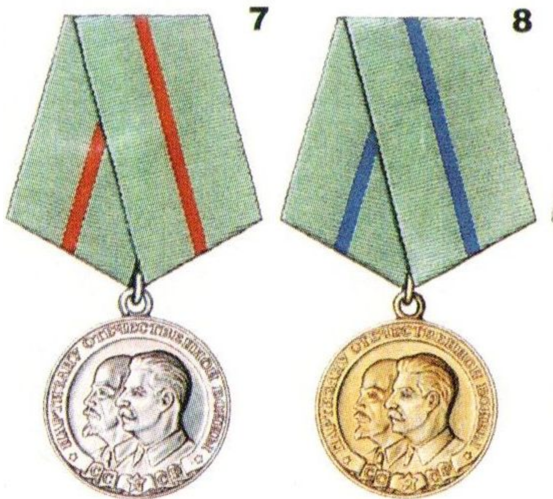
Медаль «Партизану Отечественной войны» 1 и 2 степени