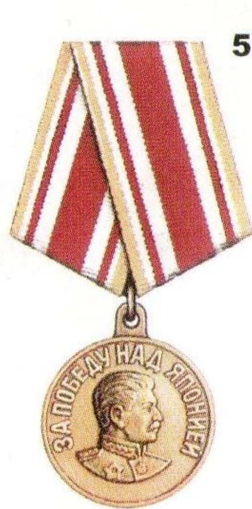
Медаль «За победу над Японией»