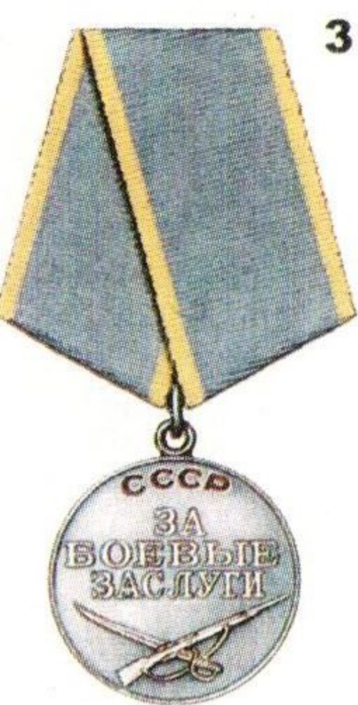
Медаль «За боевые заслуги»