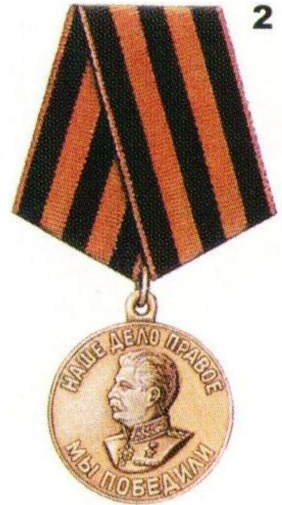
Медаль «За победу над Германией в Великой Отечественной войне 1941 – 1945 гг.»