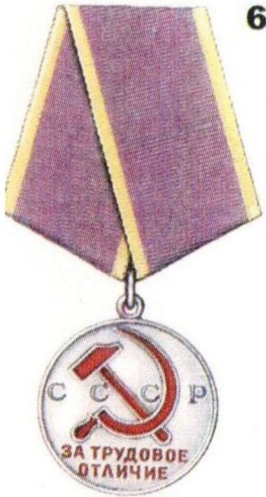
Медаль «За трудовое отличие»