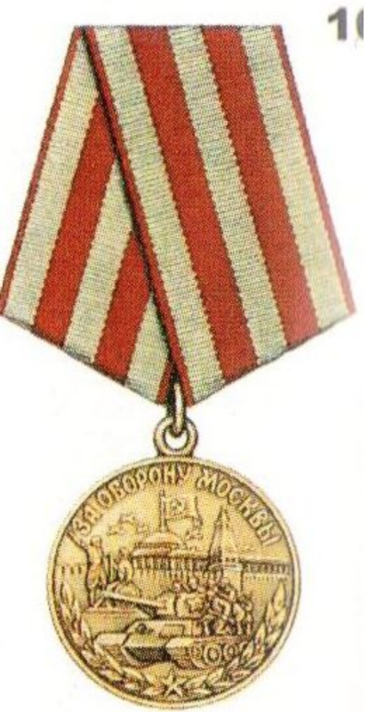
Медаль «За оборону Москвы»