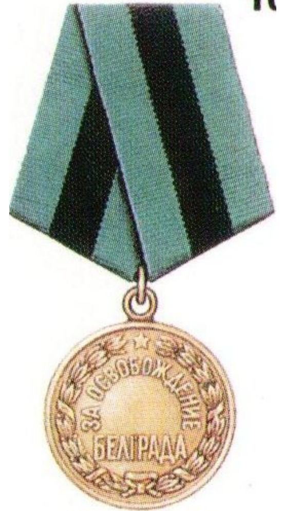
Медаль «За освобождение Белграда»