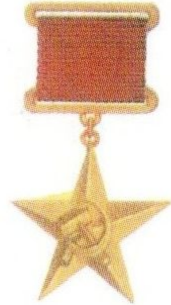
Золотая медаль «Серп и молот» Героя Социалистического Труда