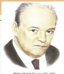
«Иллюстрация к книге «Моя жизнь» (1927, 1928)»