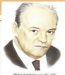
«Иллюстрация к книге «Моя жизнь» (1901, 1905)»