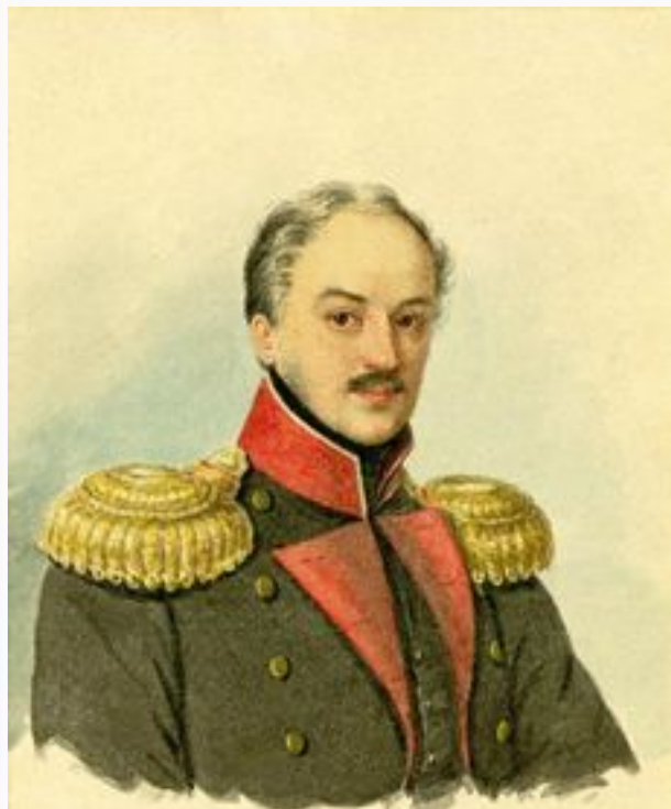
Андреев. Портрет графа П. Д. Киселева

В марте 1835 г. - создан Секретный комитет, разработавший план постепенного уничтожения крепостного права с полным обезземелением