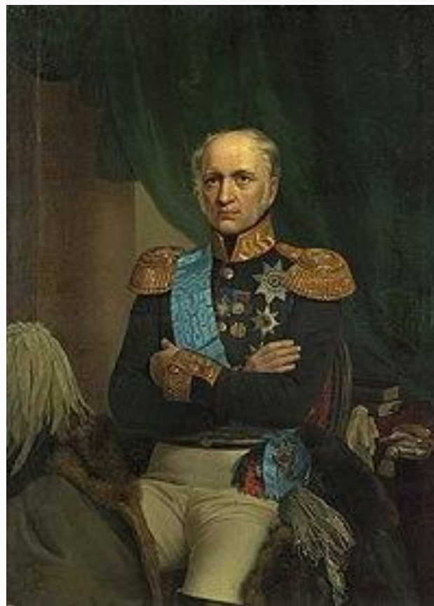
Портрет Е. Ф. Канкрин. Е. И. Ботман

Итог: В России установилось достаточно устойчивое денежное обращение.