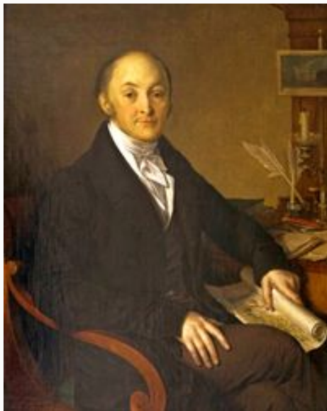
Портрет М.М. Сперанского Тропинин В.А.