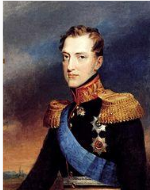
В. А. Голике. Портрет великого князя Николая Павловича (первая четверть XIX века)