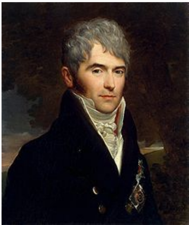
Художник Ф.Жерар, 1809 год.

В декабре 1826 г. был создан Секретный комитет : 2 проекта