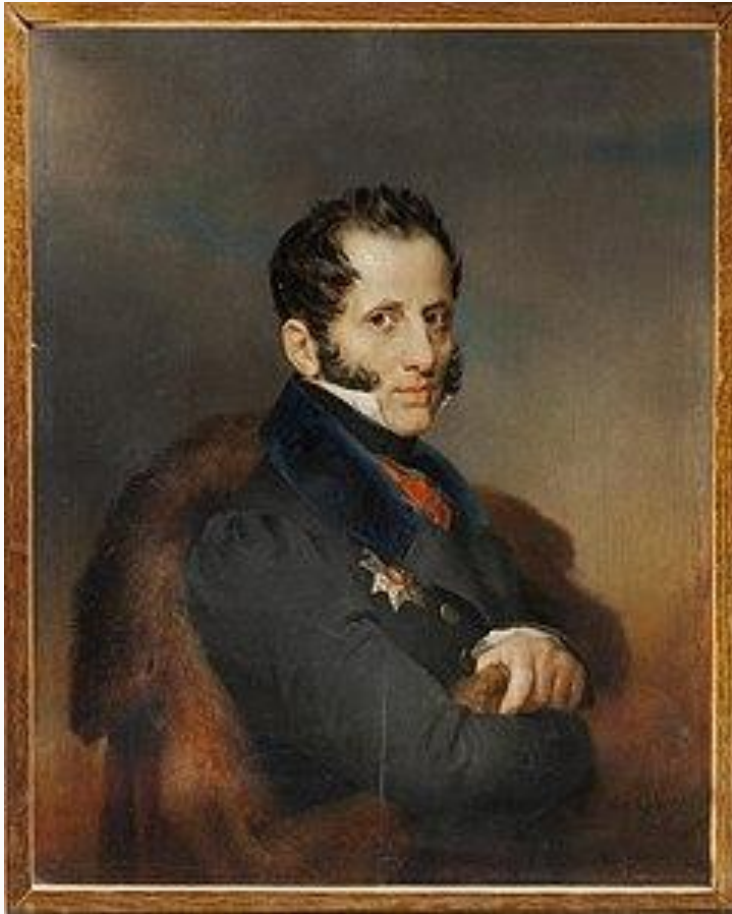
Портрет Сергея Уварова работы В. А. Голике (1833)

В 1832–1834 годах - теория официальной народности.