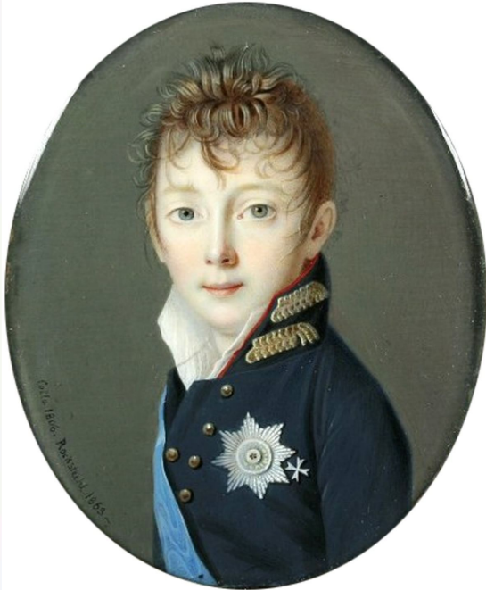
Великий князь Николай Павлович (1806 год).