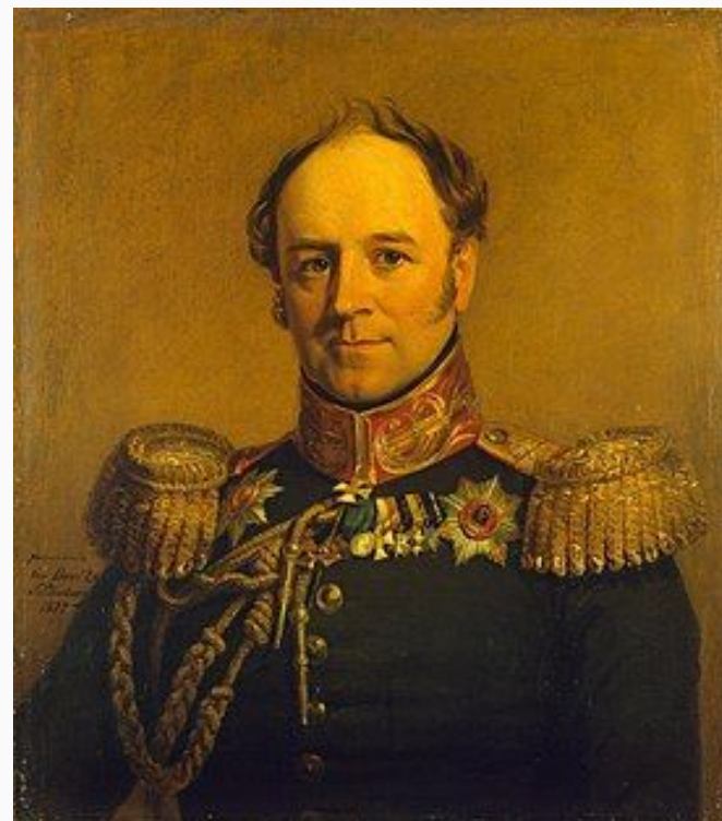
Портрет Александра Христофоровича Бенкендорфа. Джордж Доу