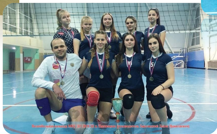
Волейбольная команда ФБУ ДО ПРСН в Липовом (футбольный стадион Липа Николаевна)