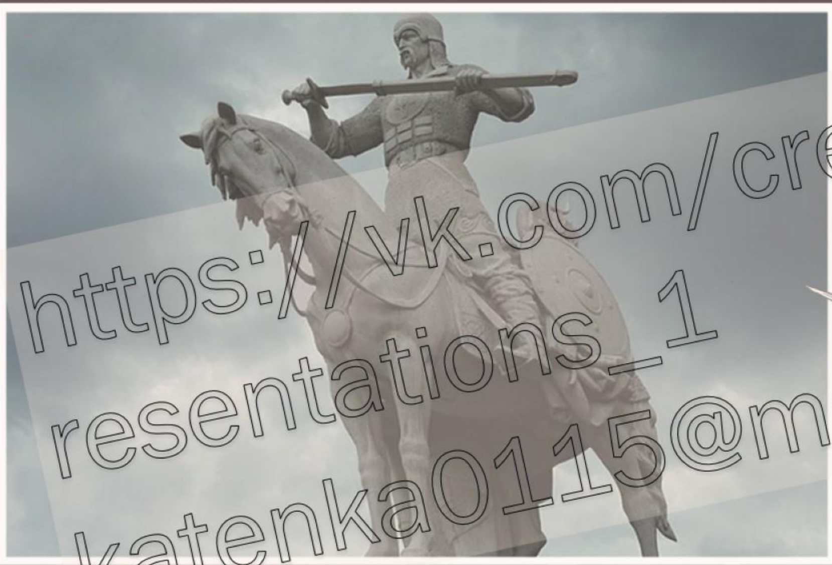
Памятник Святославу Игоревичу в селе Старые Петровцы, Киевская область