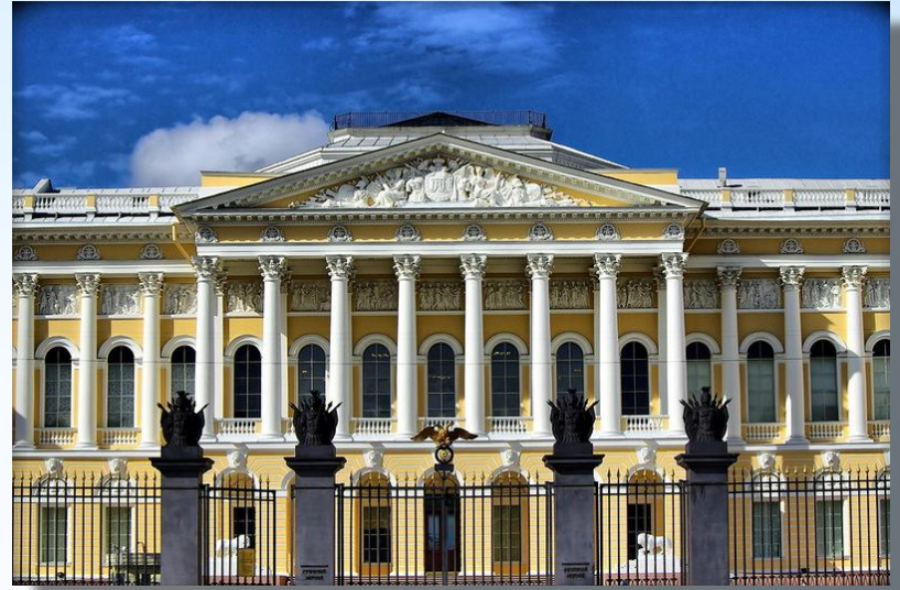
в Русском музее