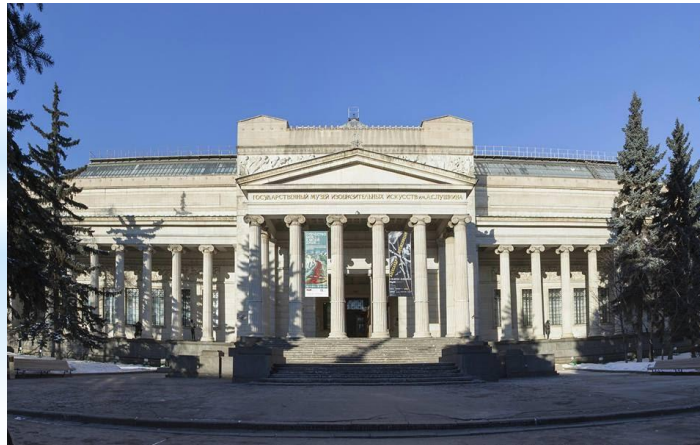
в музее изобразительных искусств имени А.С. Пушкина