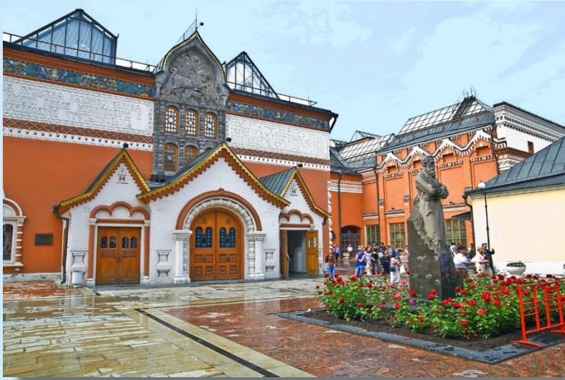
в Третьяковской галерее