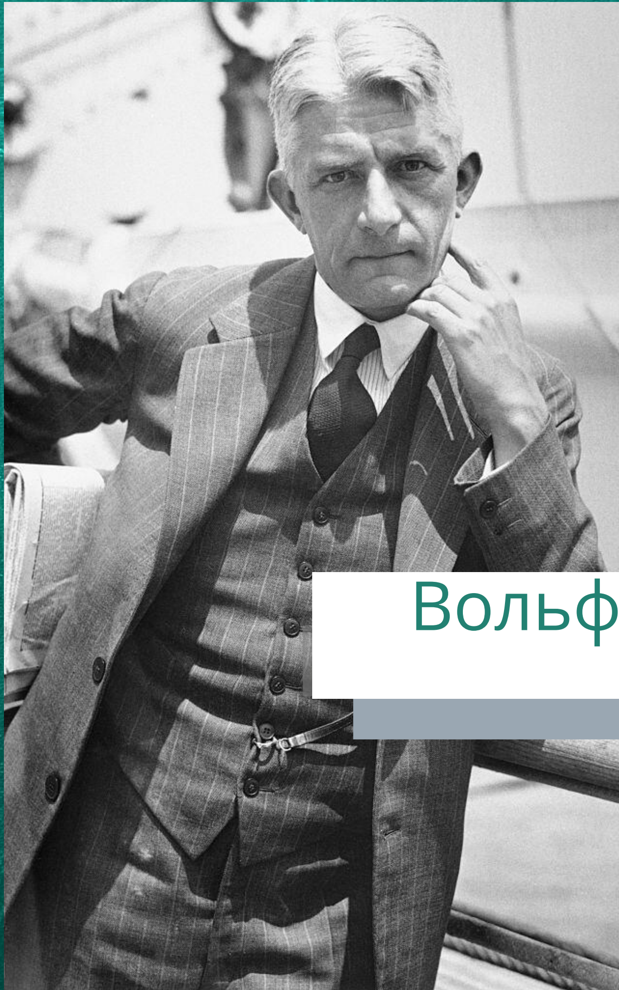
Вольфганг Кёллер 21.01.1887 - 11.06.1967г.г.