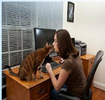
«Облучение» целебными волнами