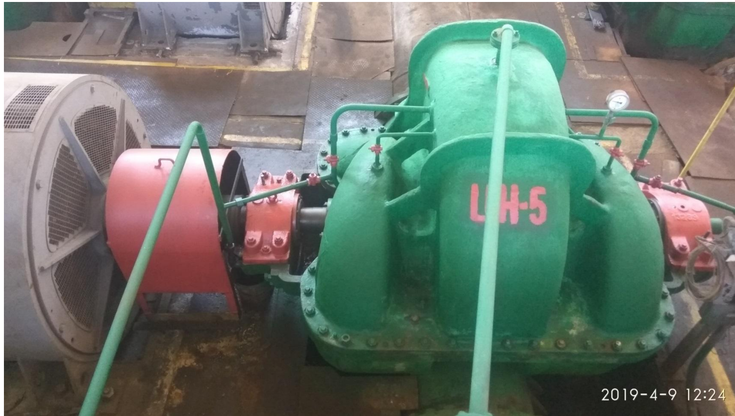
Циркуляционные насосы БНС

Фоменко И.Н. маш.берег.н/с Датаопроса: 05.04.2019 Оценка: 82,0%