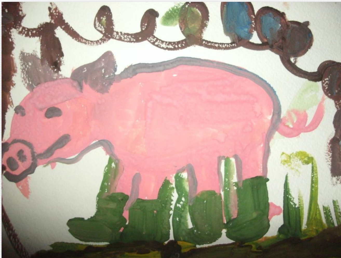
Песня «Зеленые ботинки»