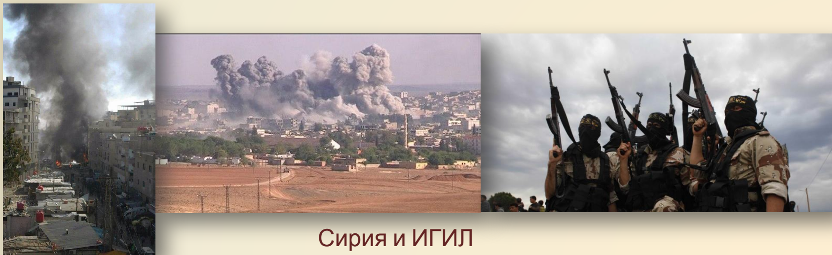
Сирия и ИГИЛ