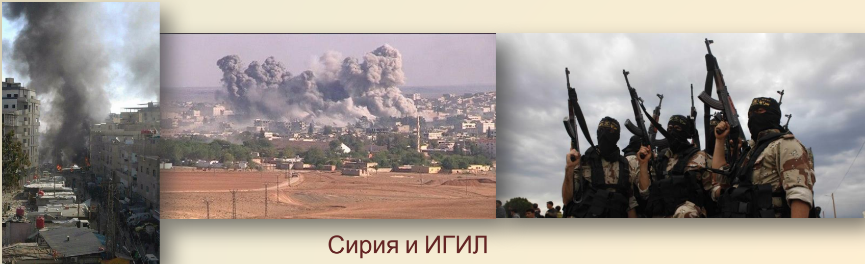
Сирия и ИГИЛ