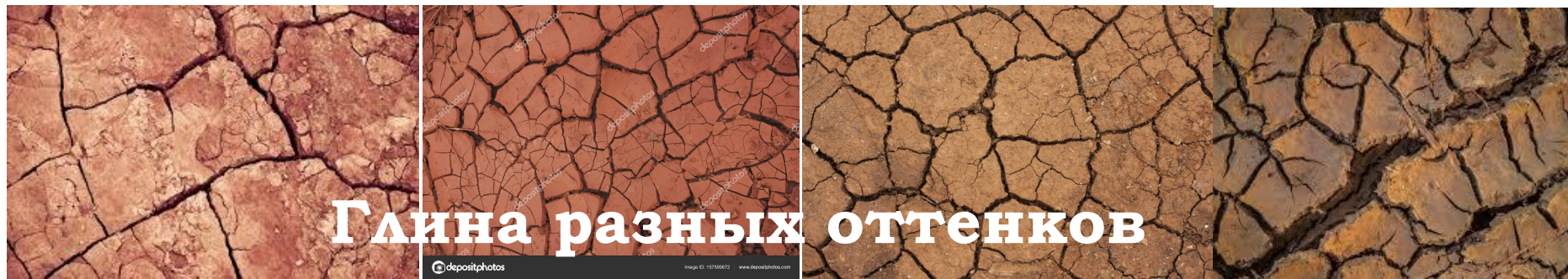
Глина разных оттенков