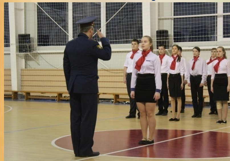
Смотр строя и песни