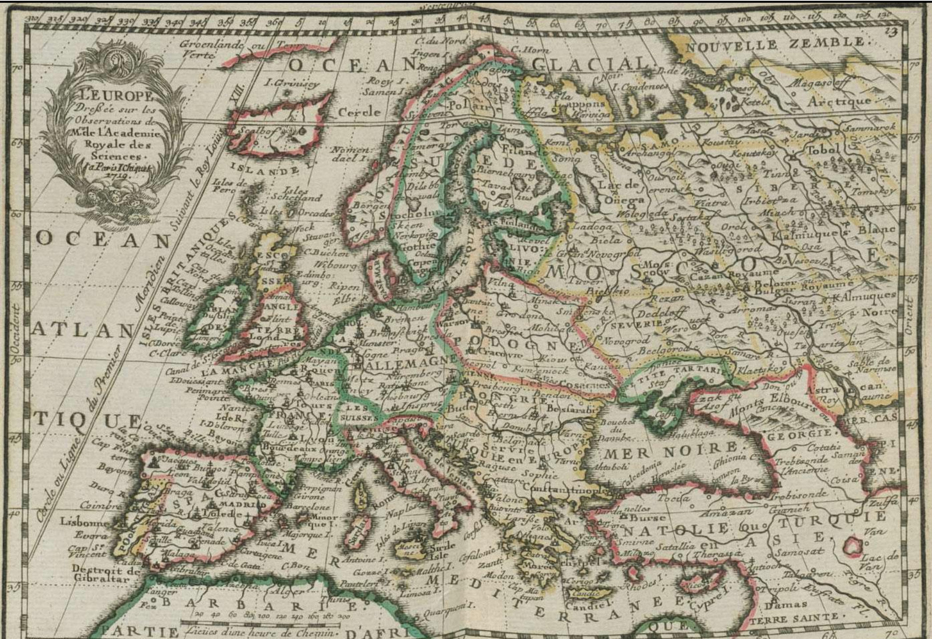
Карта Европы начала XVIII века