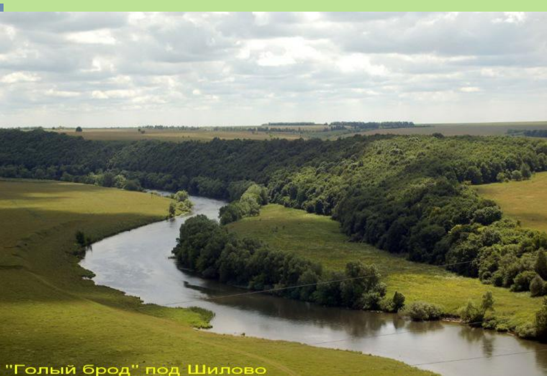
"Голый брод" под Шилово