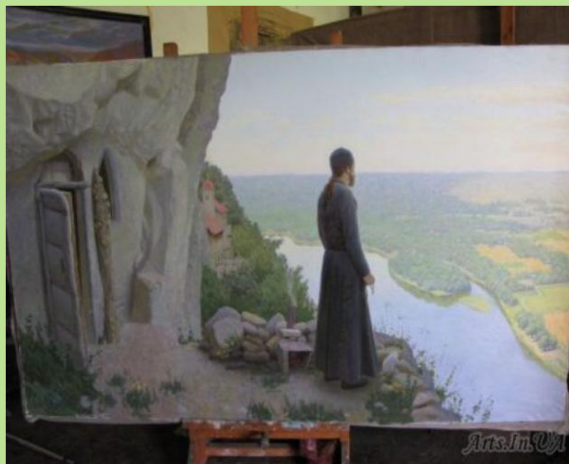
А. Израйлян «Утро»