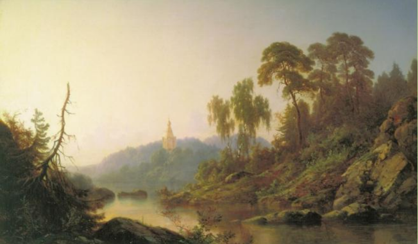
П. Джогин «На Валааме»