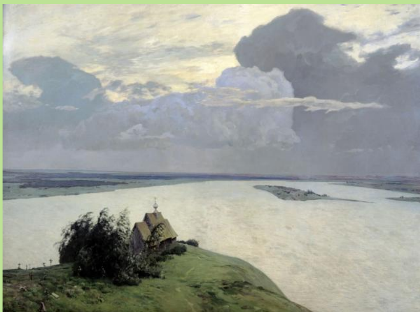
И. Левитан «Над вечным покоем»