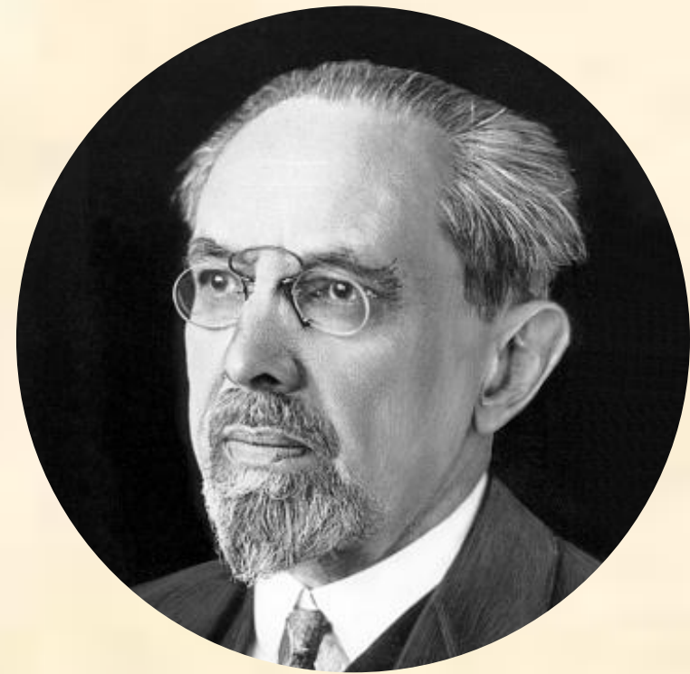
Вернер Зомбарт 1863–1941 гг.

Его традиционное устройство, господствовавшие веками устои, превратились в нечто новое