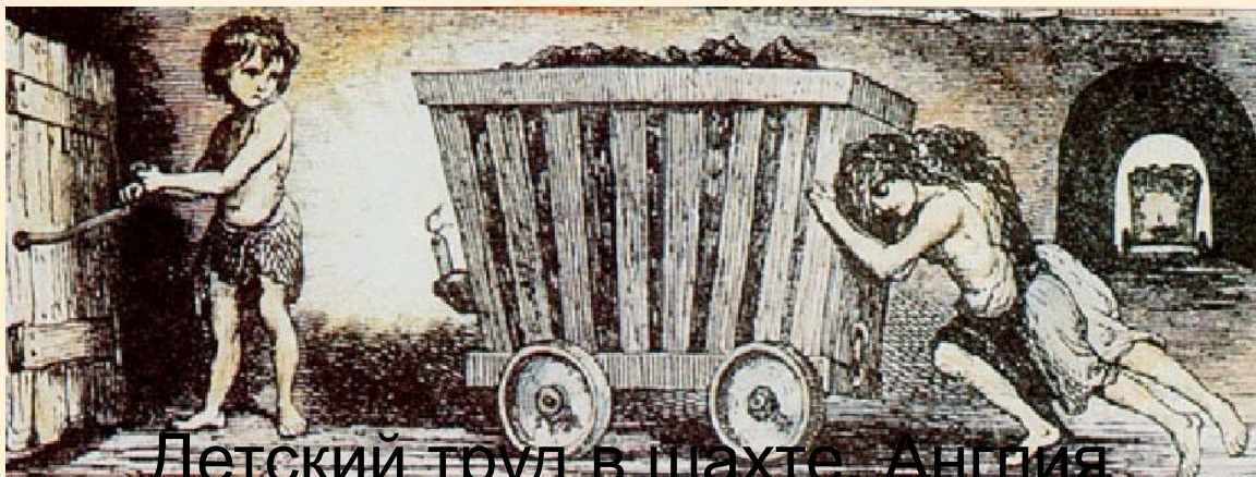
Детский труд в шахте. Англия