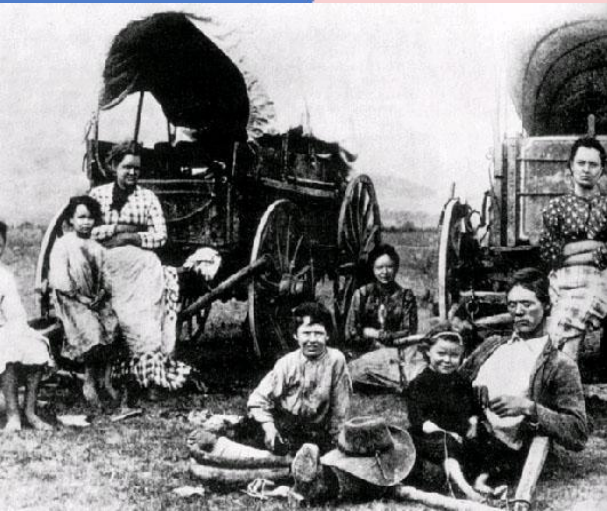
Эмигранты из Западной Европы. США XIX в.