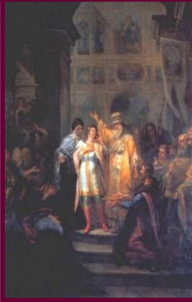
Г. Угрюмов. Призвание Михаила Федоровича Романова на царство.

После освобождения Москвы вновь встал вопрос о власти и собрался Земский Собор.