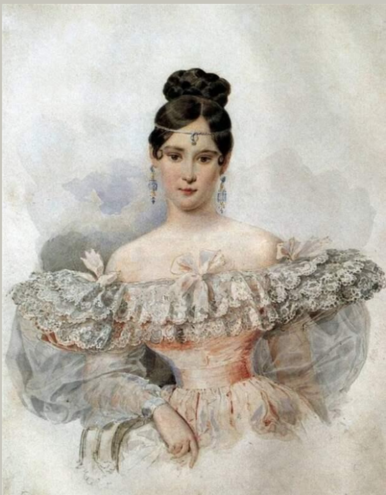
Наталия Гончарова Николаевна жена А.С.Пушкина.