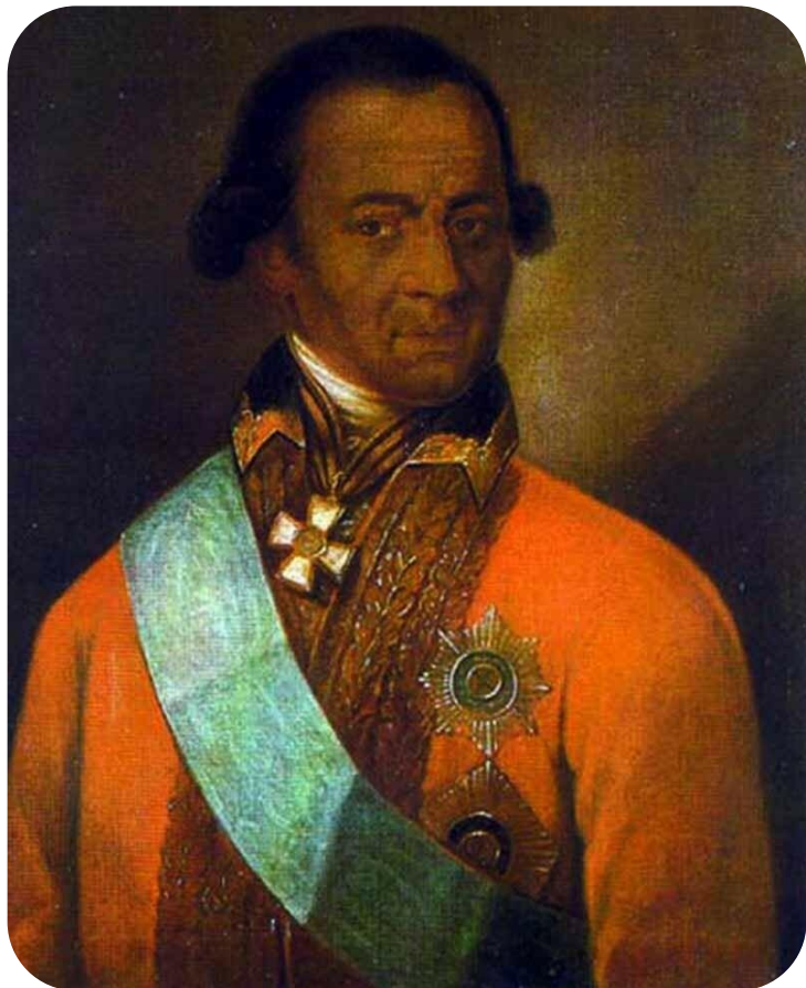
Абрам Петрович Ганнибал