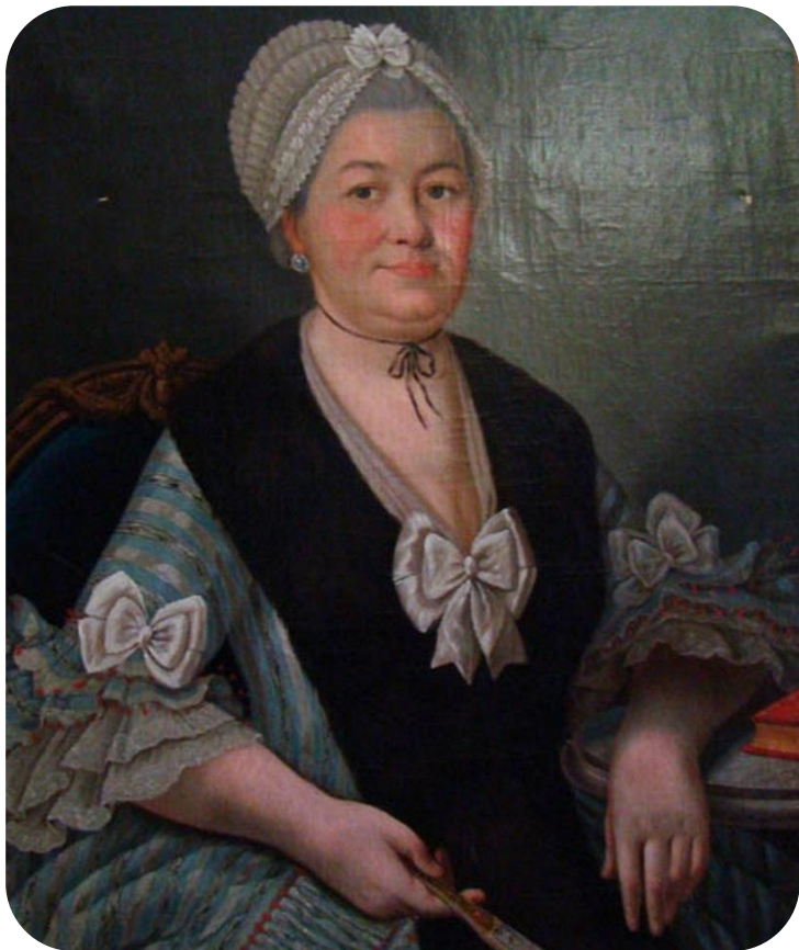
Ганнибал Мария Алексеевна бабушка А. С. Пушкина.