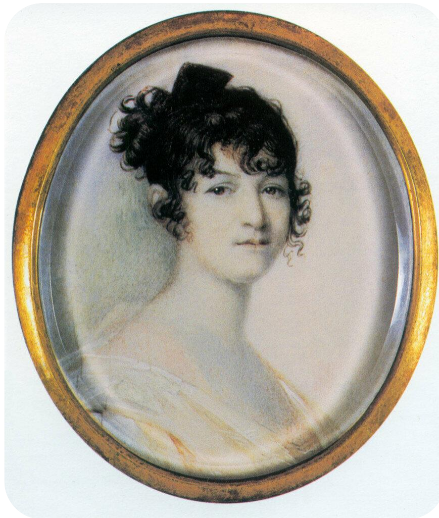
Надежда Осиповна Пушкина