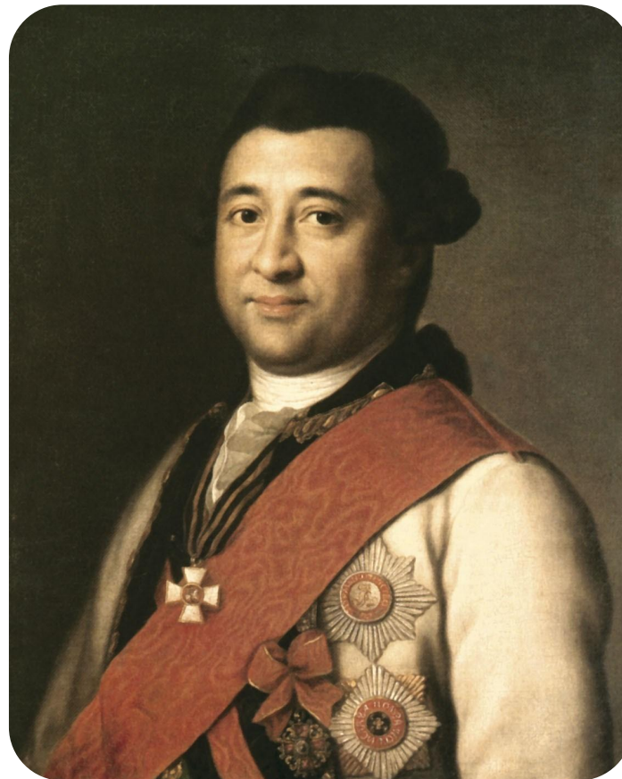
Осип Абрамович Ганнибал дедушка А.С.Пушкина