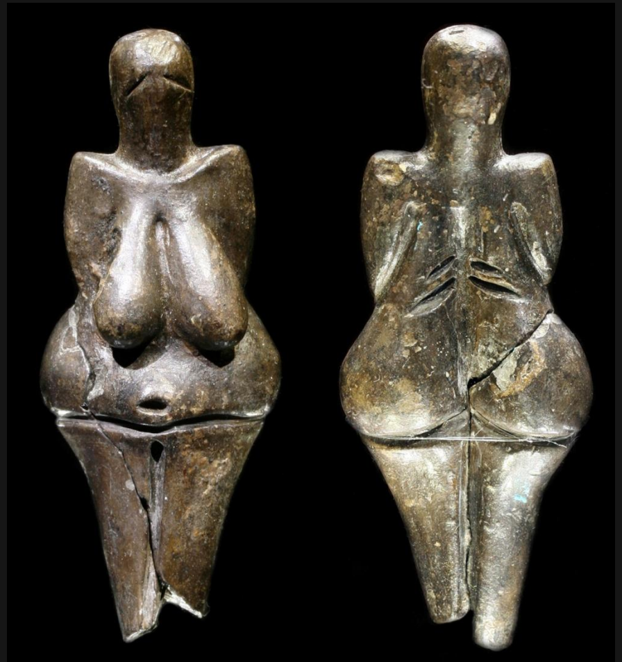
Вестоницкая Венера (Чехия)