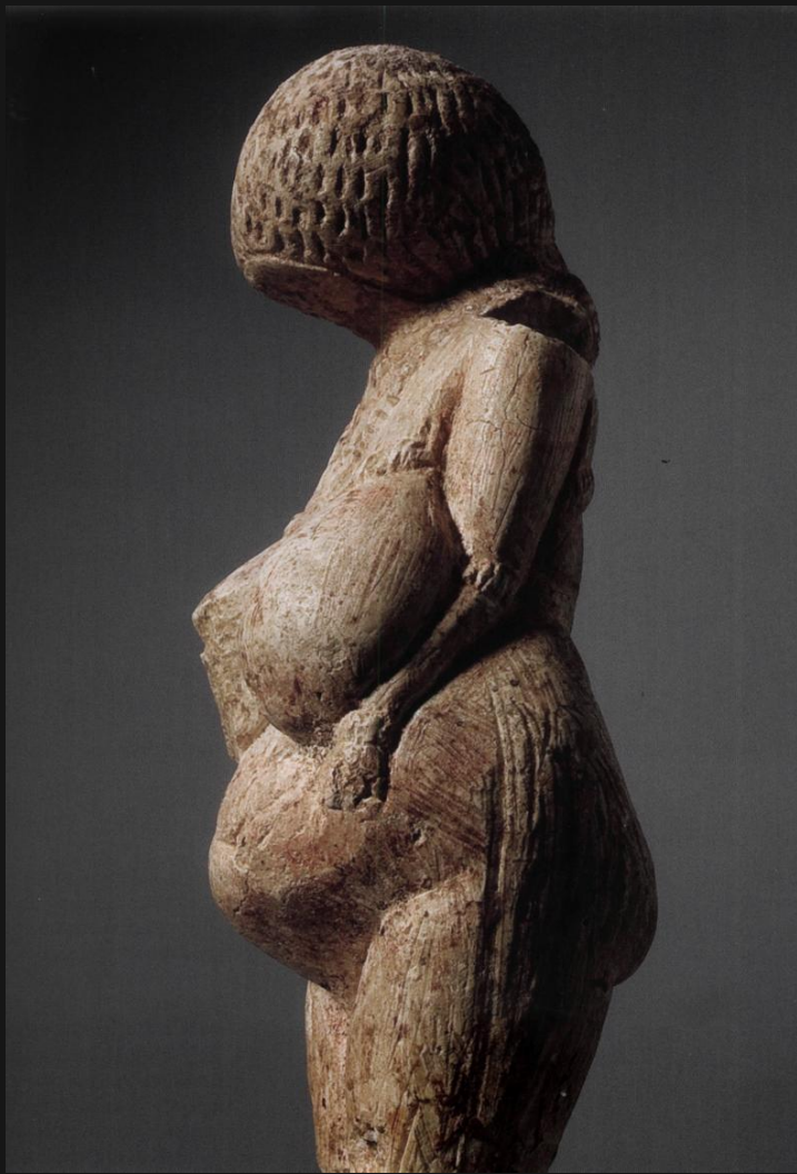
Венера из Костенок (Россия)