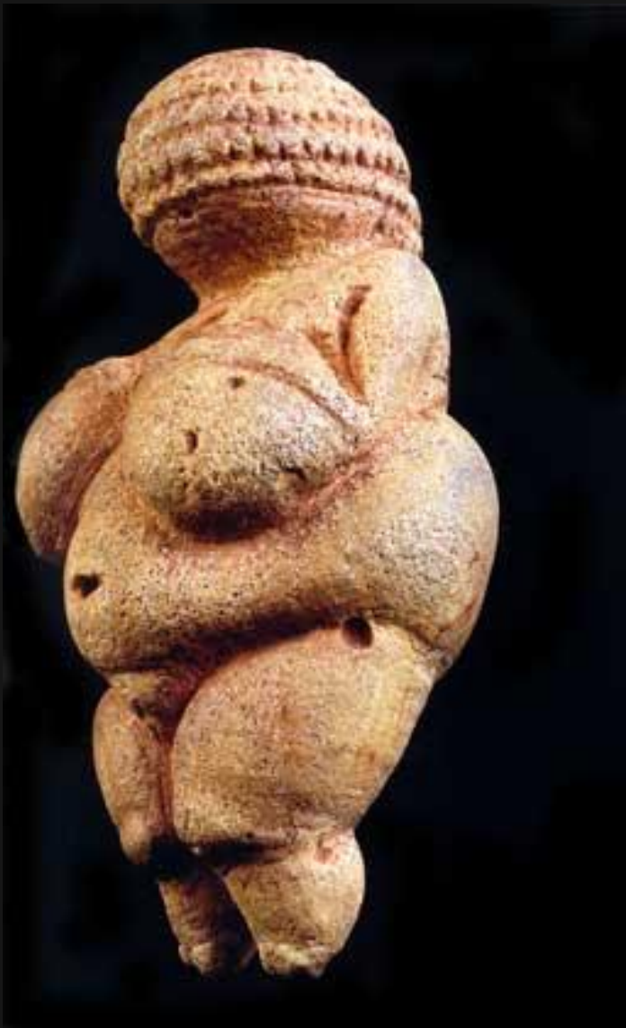
Венера Виллендорфская (Австрия)