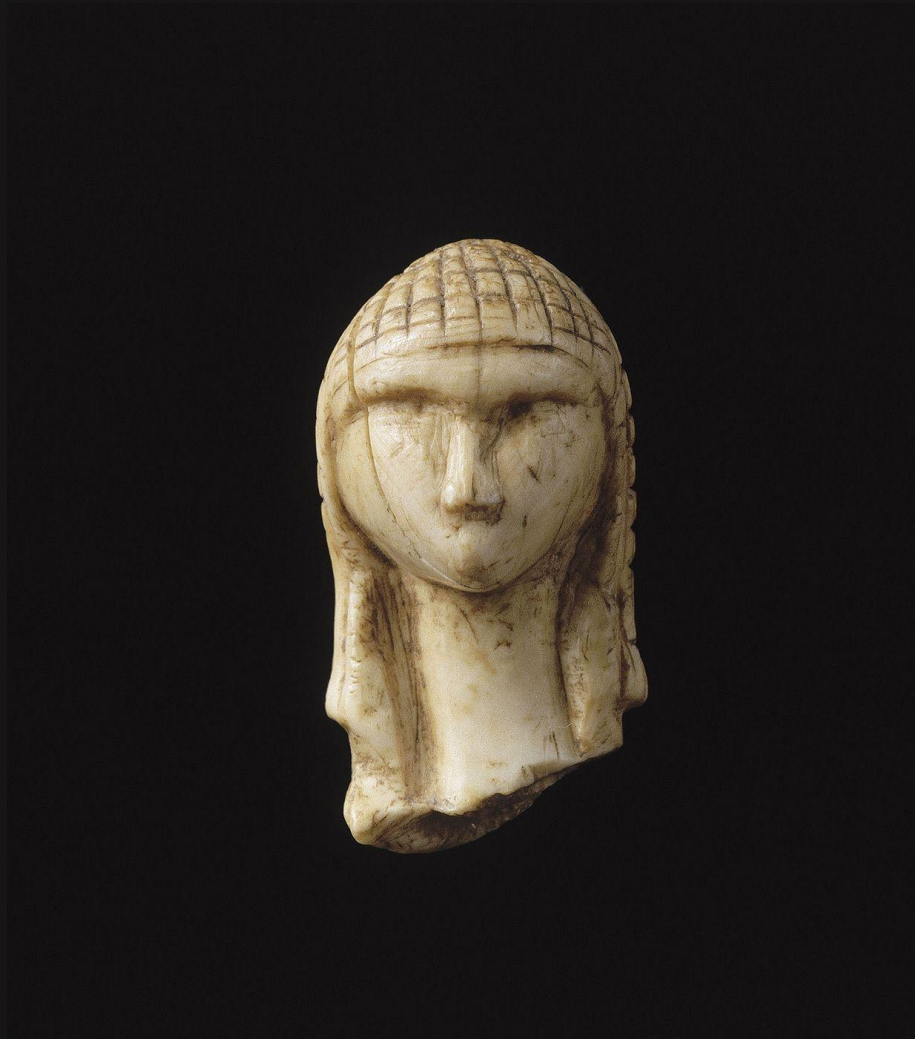
Дама с капюшоном (Франция)