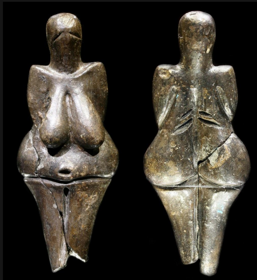
Вестоницкая Венера (Чехия)