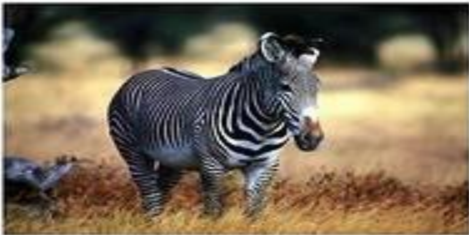
photos of animals