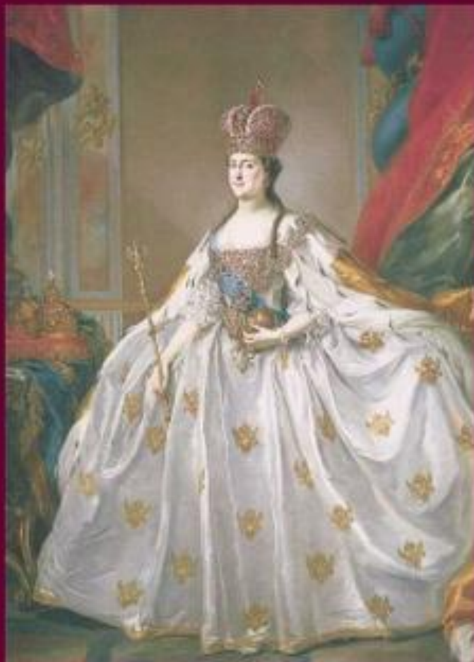
Стефано Торелли «Коронационный портрет Екатерины II»