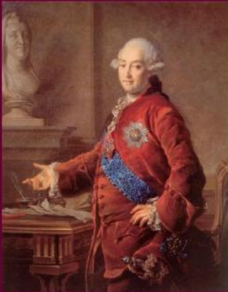
Дмитрий Григорьевич Левицкий

Портрет вице-канцлера князя Александра Михайловича