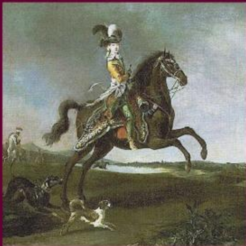
Художник Георг Преннер «Портрет императрицы Елизаветы Петровны»