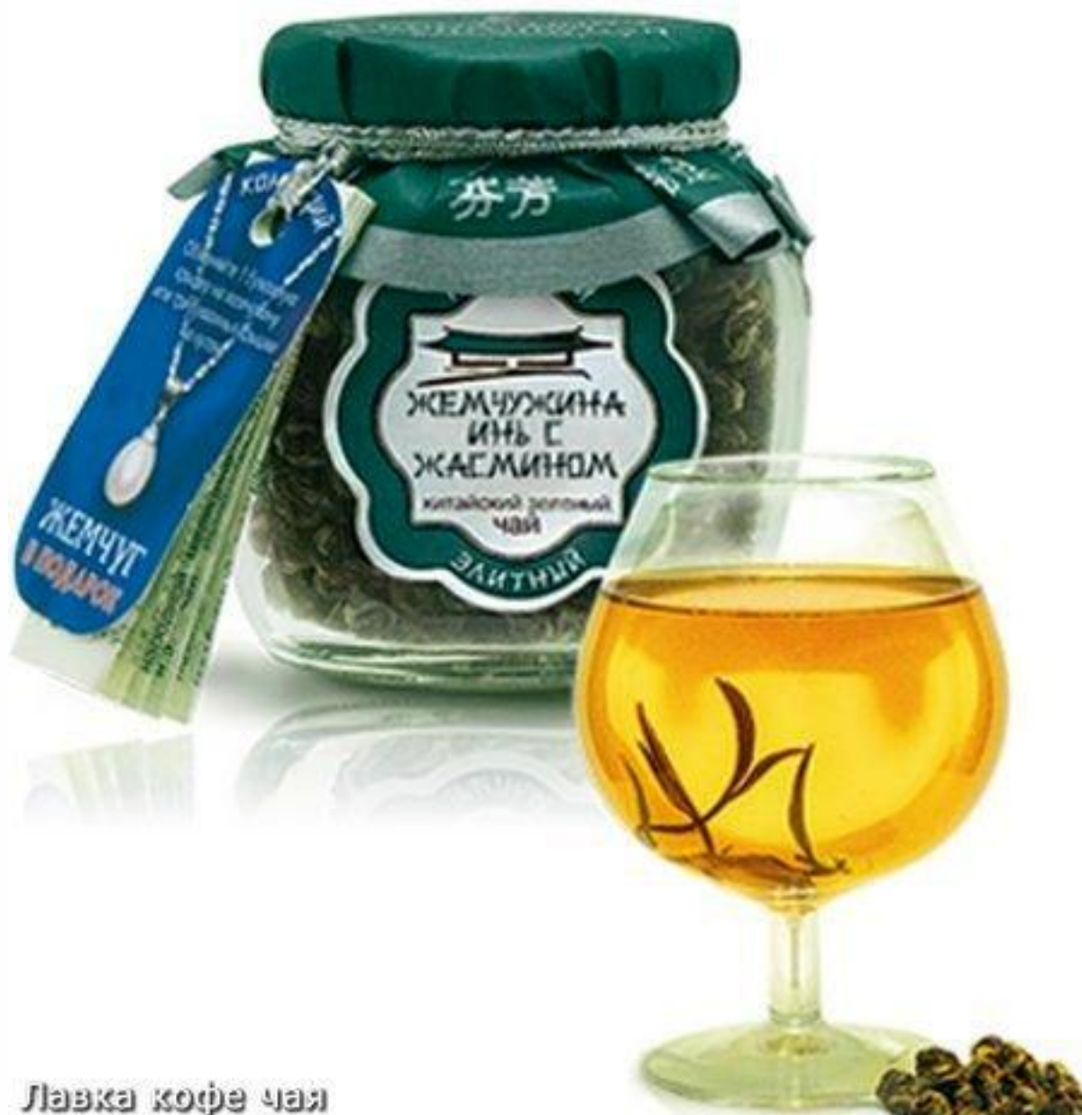
Лавка кофе чая