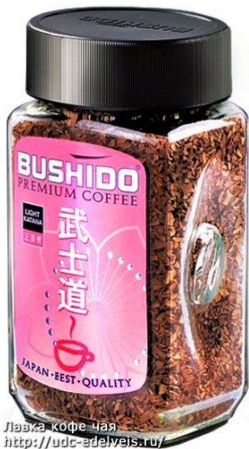
Лавка кофе чая http://udc-edelweis.ru/