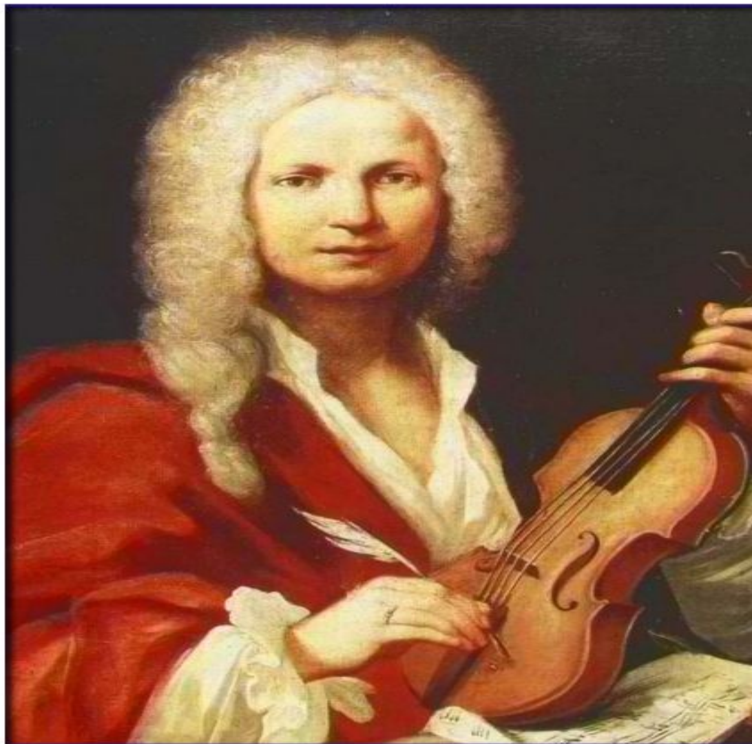
Антонио Вивальди (1678- 1741)