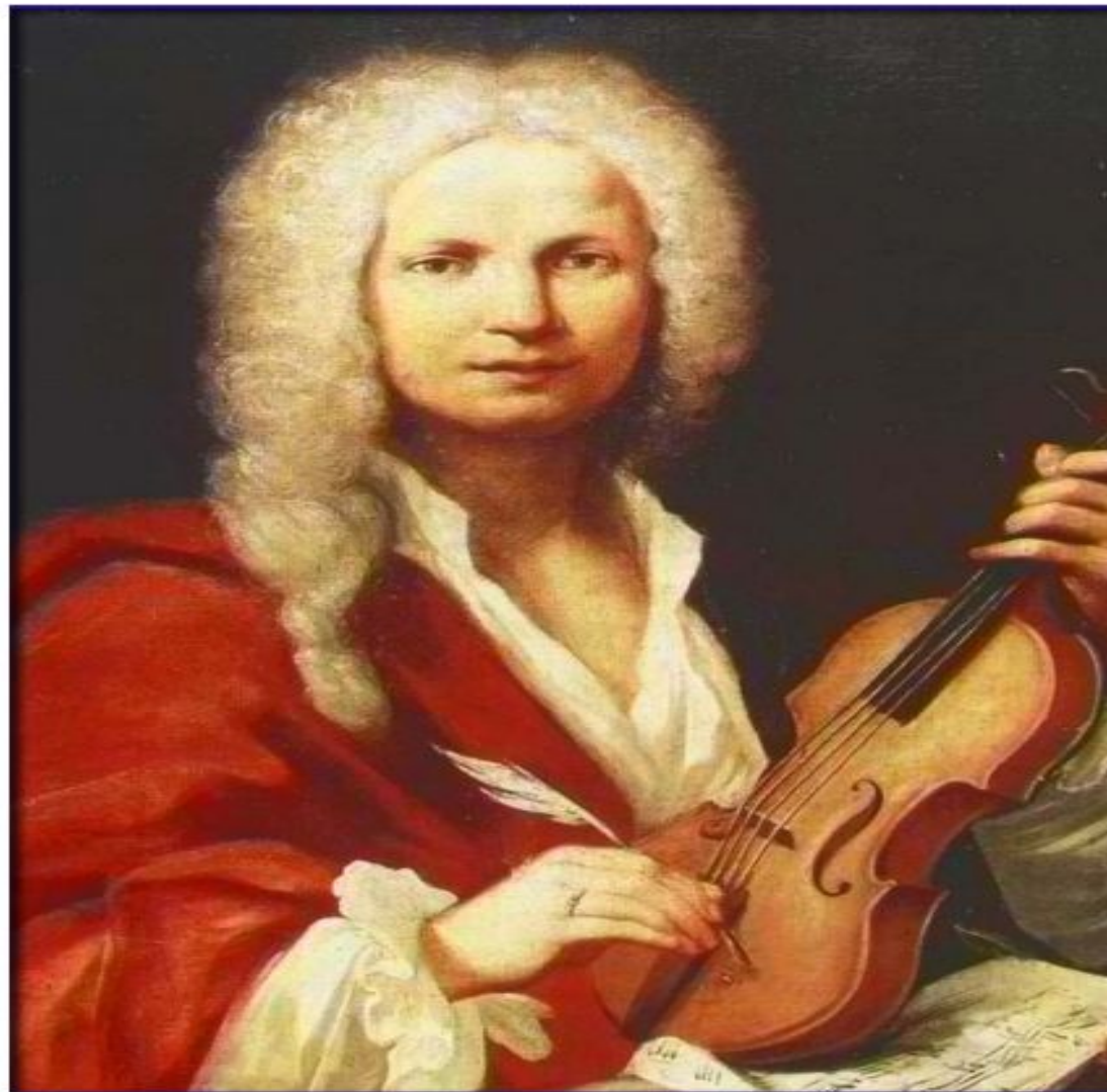
Антонио Вивальди (1678- 1741)