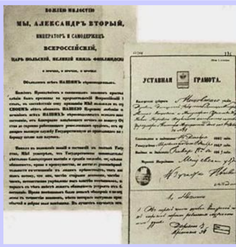
Документы «Великой реформы».

В декабре 1860 г. Проект был рассмотрен в Госсовете и 19 февраля 1861 г. Александр II подписал «Манифест» и «Положения».