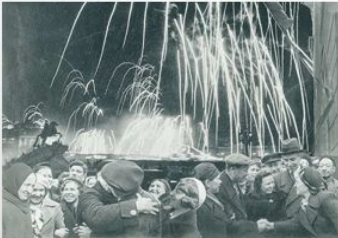
«Великая победа одержана советскими войсками под Ленинградом!»