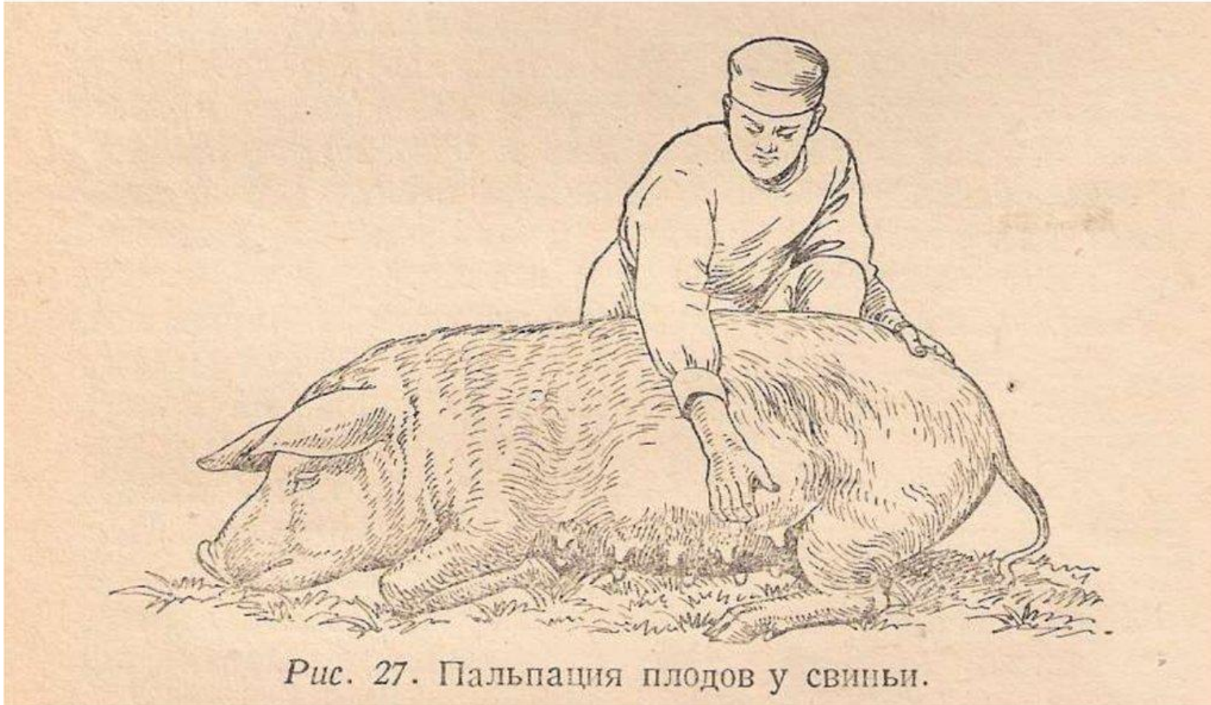
Рис. 27. Пальпация плодов у свињи.

Пальпация у свиней. Прощупать плод удаётся с 3-го месяца беременности лишь у свиноматок нижесредней упитанности, на уровне последних 2-х сосков. Распознают плоды по твёрдой консистенции и по их движениям-толчкам.