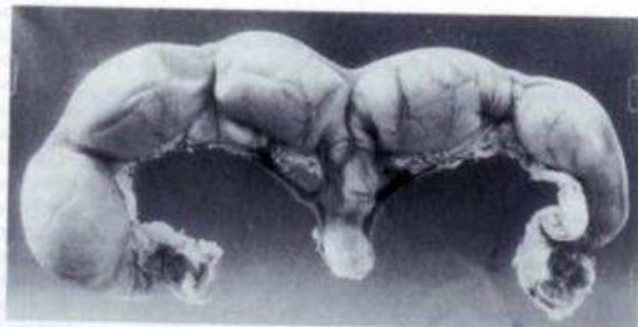
Fig. 3.24 Uterus and ovaries of a bitch, pregnancy of about 30 days. Note five conceptual swellings.