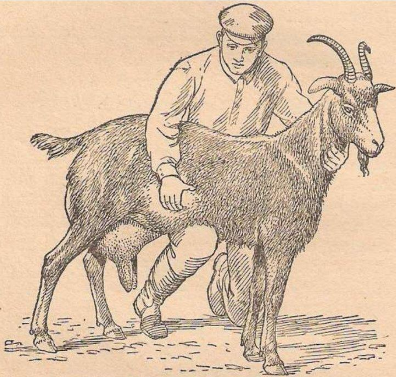
Рис. 26. Пальпация плодов у козы.