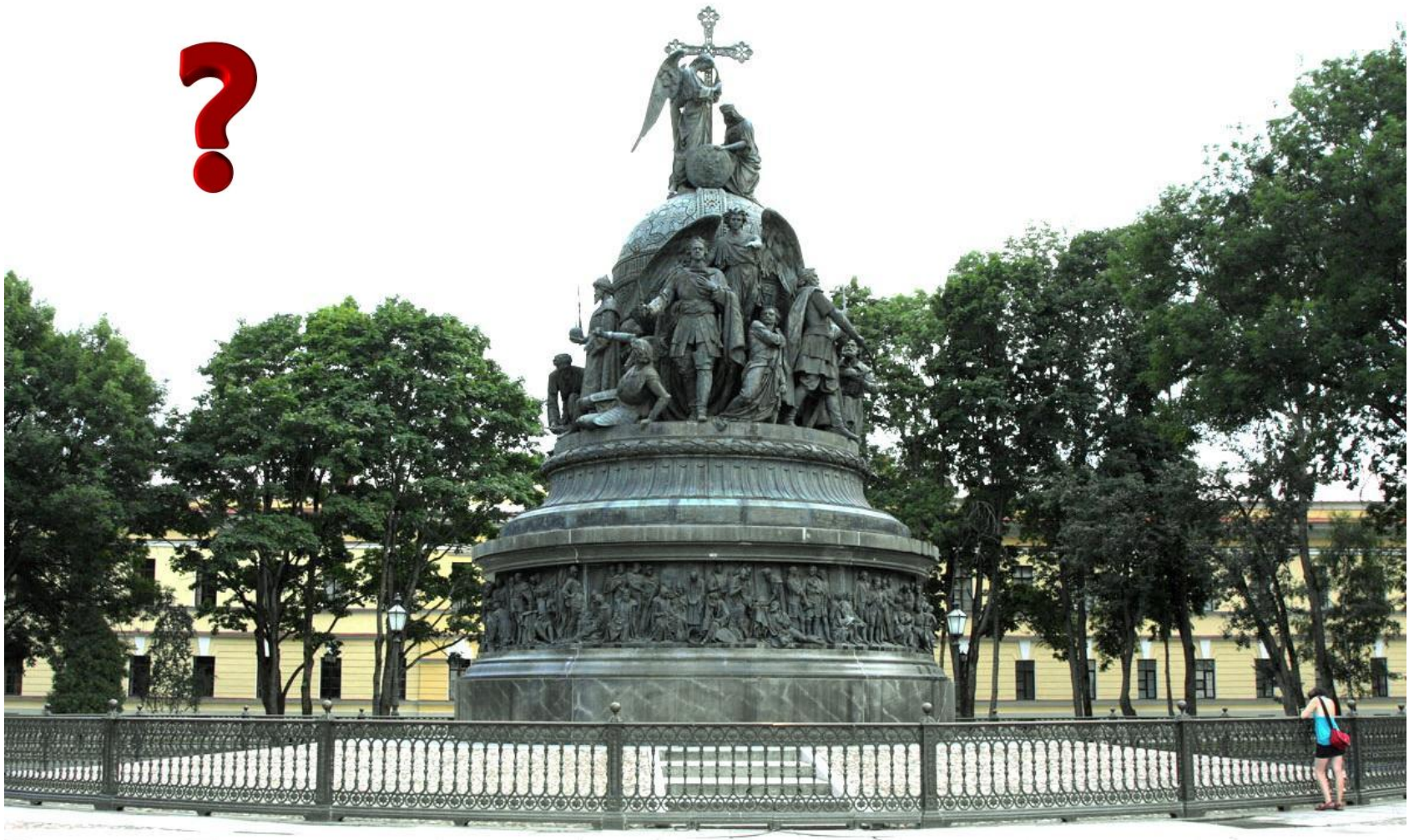
Памятник 1000-летию России, 1862 г., скульптор Микешин. Новгород Великий