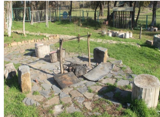
Место для розжига костра Определитель возраста деревьев (на заднем фоне)