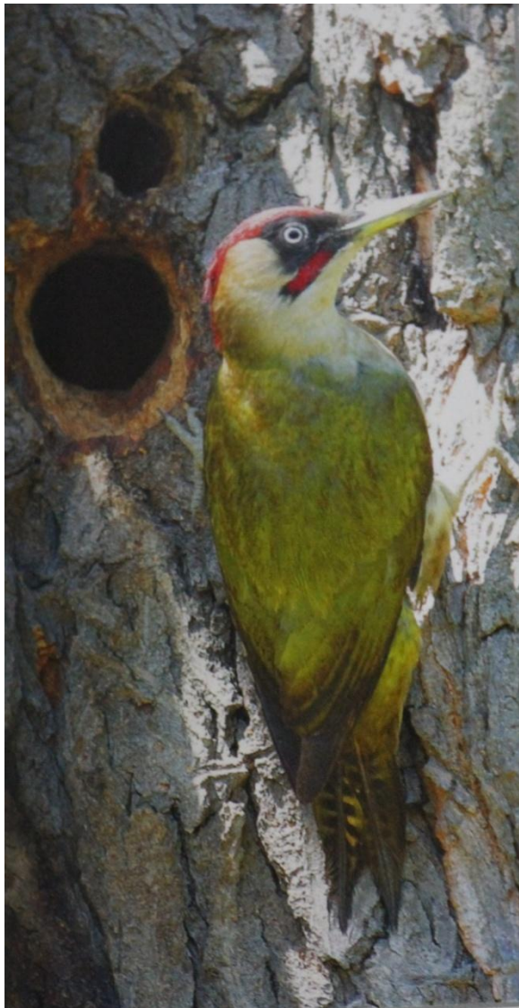
● Зеленый дятел