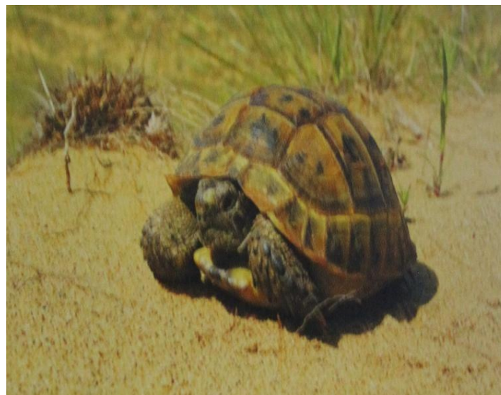
● Средиземноморская черепаха