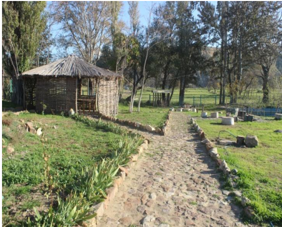
Экологическая тропа и беседка бассейн для рыб