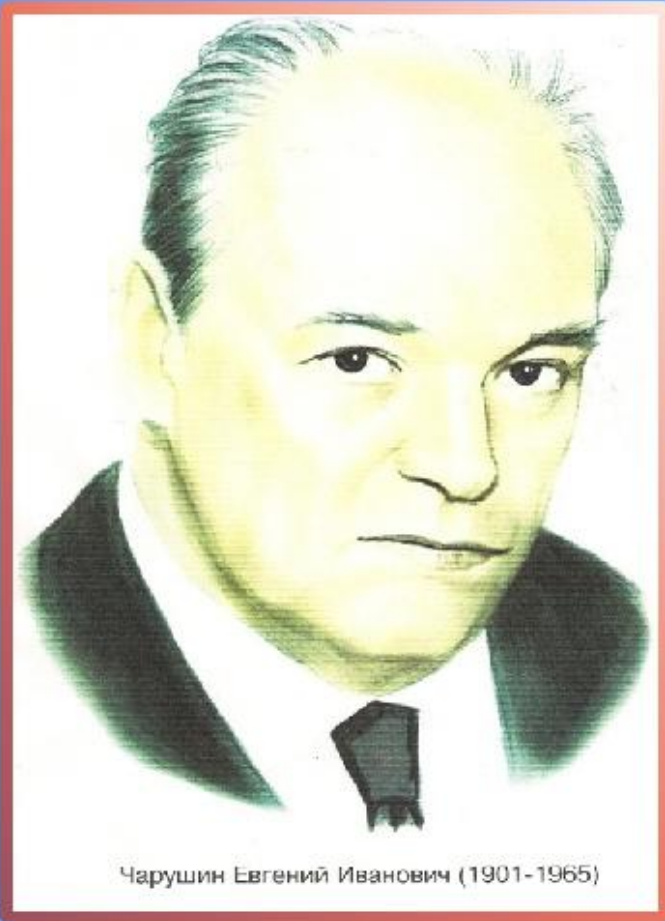
Чарушин Евгений Иванович (1901-1965)