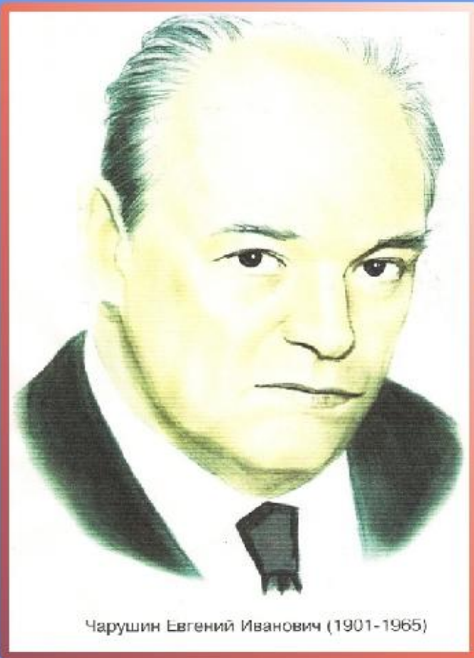
Чарушин Евгений Иванович (1901-1965)