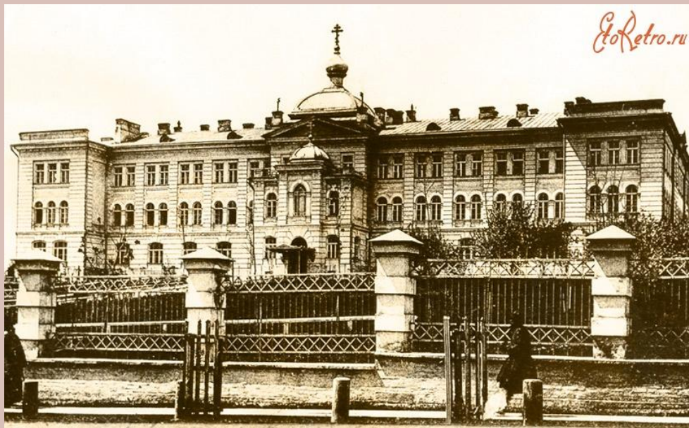
Здание духовной семинарии

1889 году местные власти выкупили у помещицы М. М. Киселевой здание старинной усадьбы.