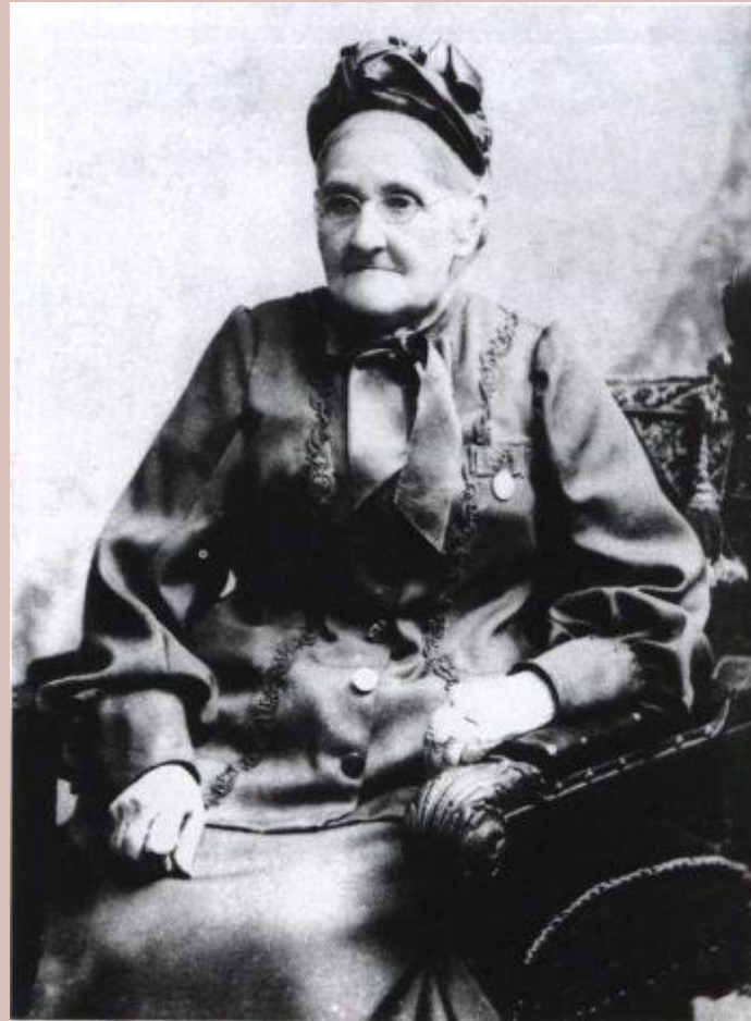
Фото из экспозиции дома-усадьбы А. Н. Радищева