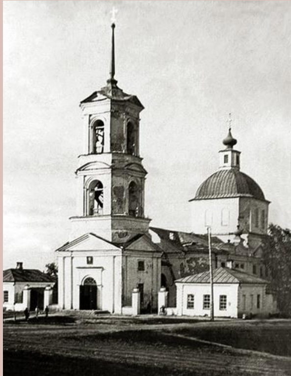
Нач. XX века