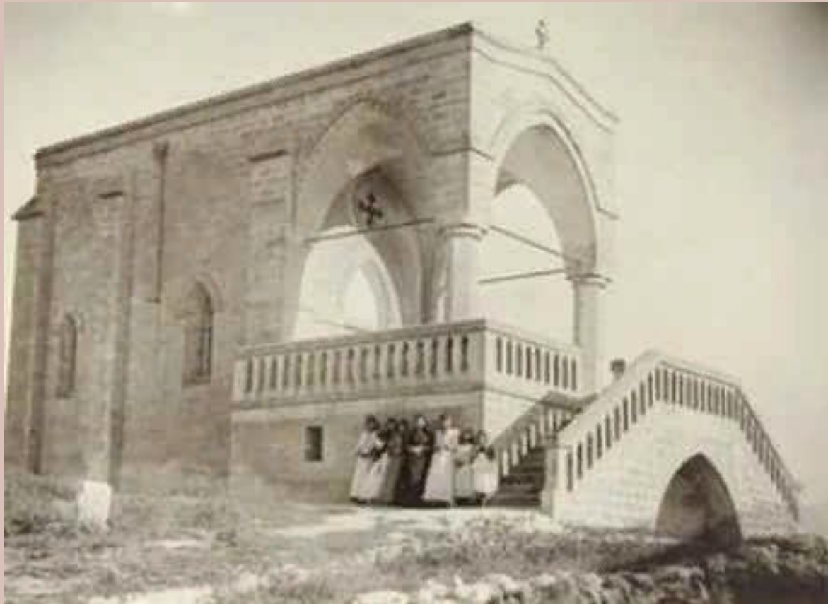
Фото А. Якубовича, 1880 г.

Построен на средства русской благотворительницы М. М. Киселевой