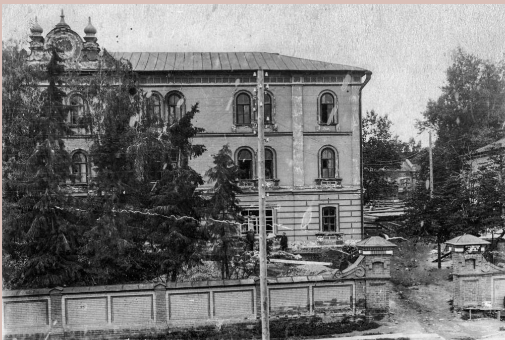
1 корпус богадельни. Фото 1930-х гг.

В 1852 году М. М. Киселева приобрела большую усадьбу в Пензе, выходящую на Верхнюю Пешую (ныне ул. Куйбышева) и Дворянскую (ныне ул. Красная) улицы.