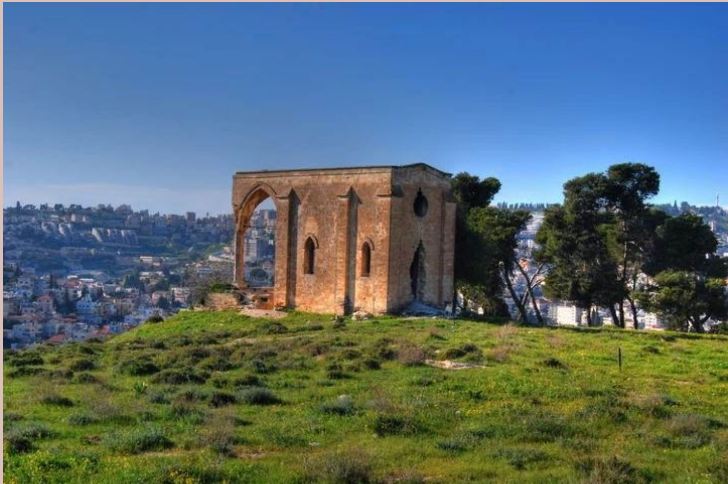
Фото 2008 г. до реставрации