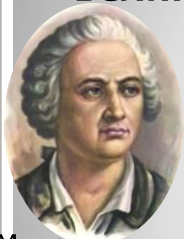
Михаил Васильевич Ломоносов