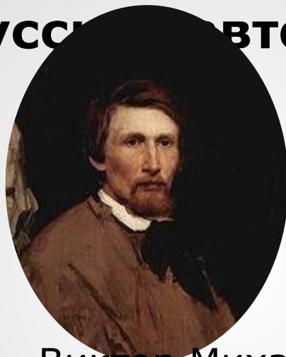
Виктор Михайлович Васнецов