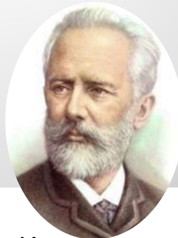
Пётр Ильич Чайковский