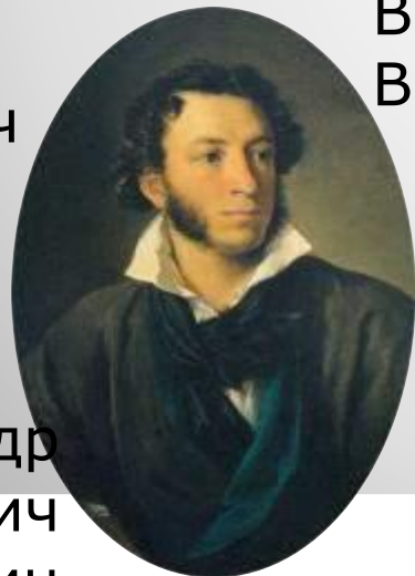
Александр Сергеевич Пушкин