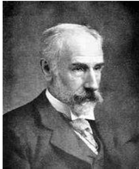
Уильям Джеванс (1835–1882)