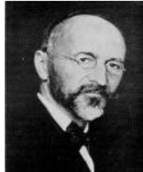
Евгений Бем-Баверк (1851–1914)