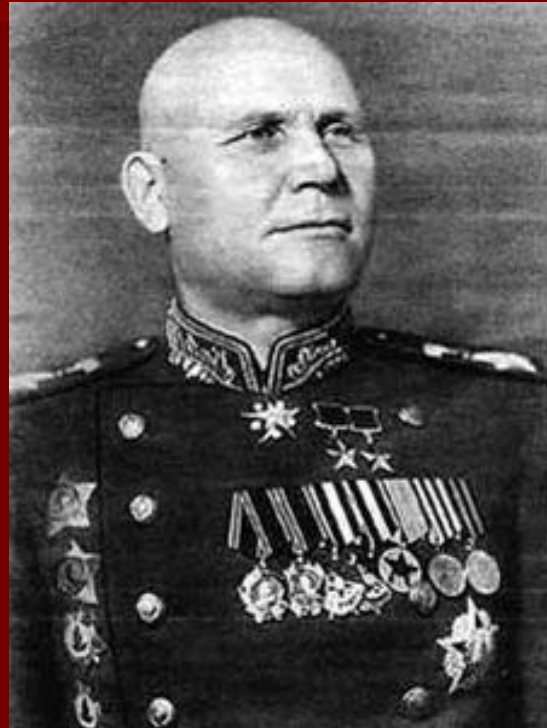
Маршал Советского Союза Иван Степанович Конев