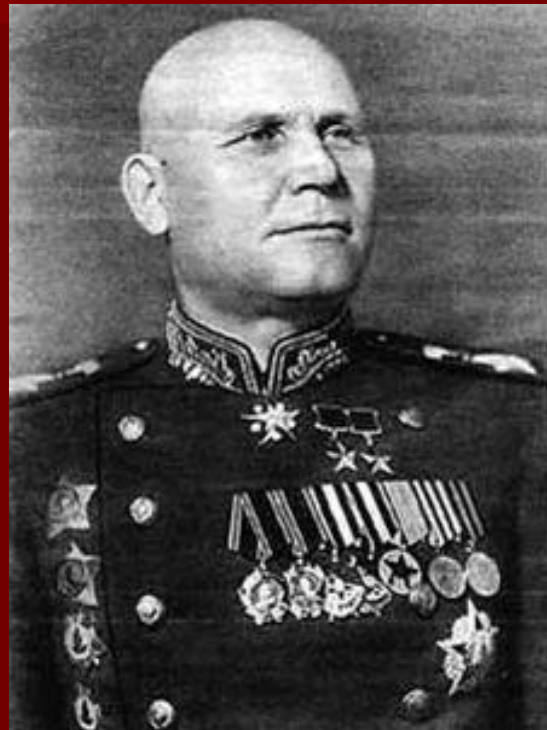
Маршал Советского Союза Иван Степанович Конев