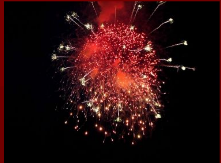
Салют в Москве