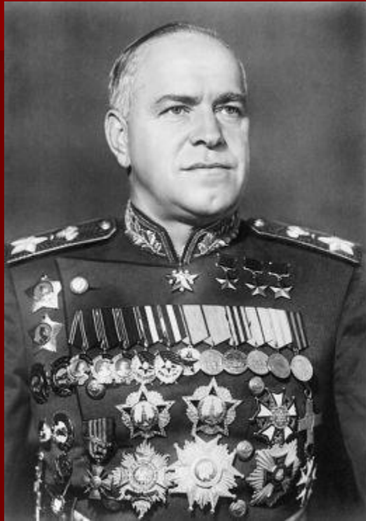
Маршал Советского Союза Георгий Константинович Жуков.