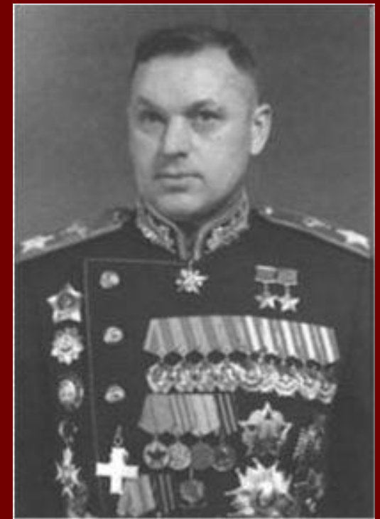
Маршал Советского Союза Константин Константинович Рокоссовский.