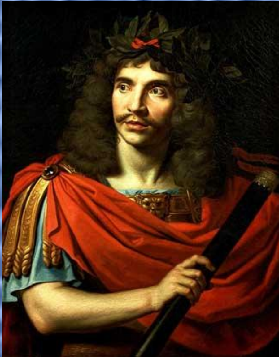
П. Миньяр. Портрет Жана Батиста Мольера