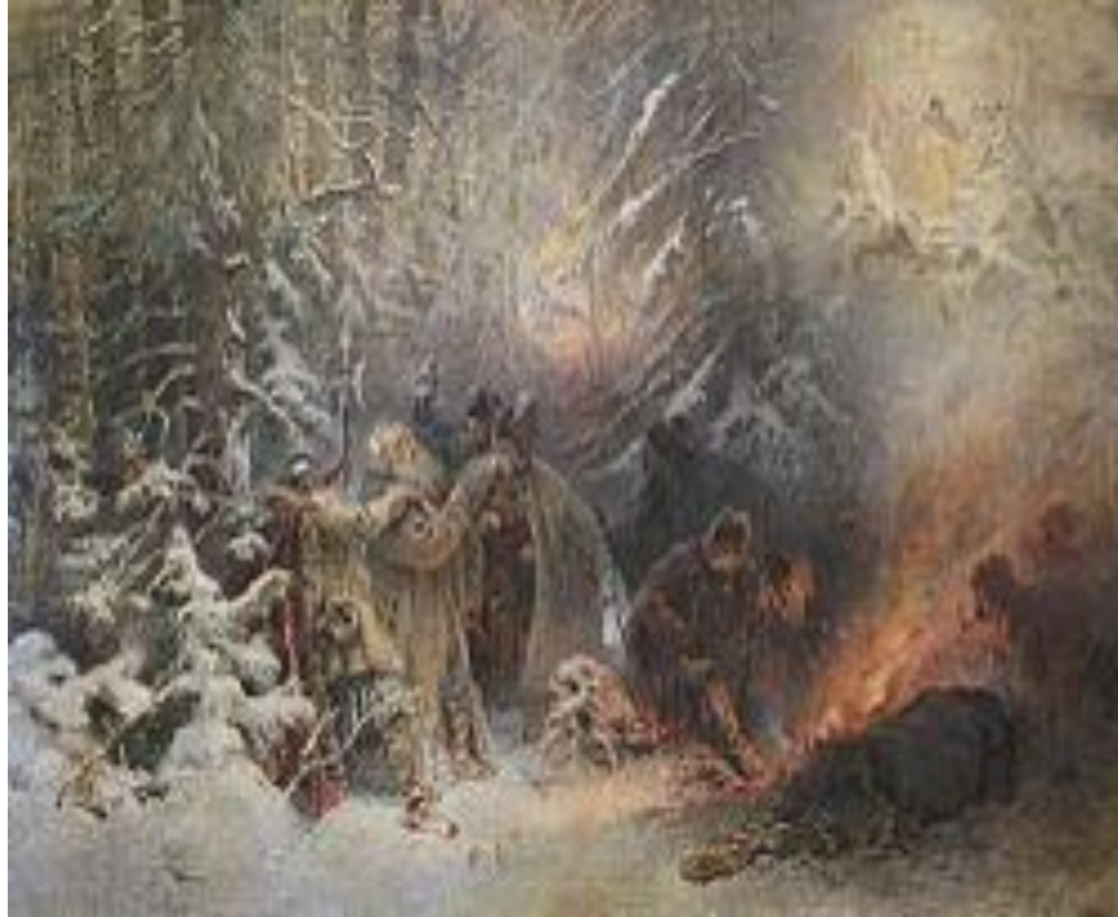
К.Е. Маковский. Иван Сусанин. 1914г. Аукцион Сотбис.