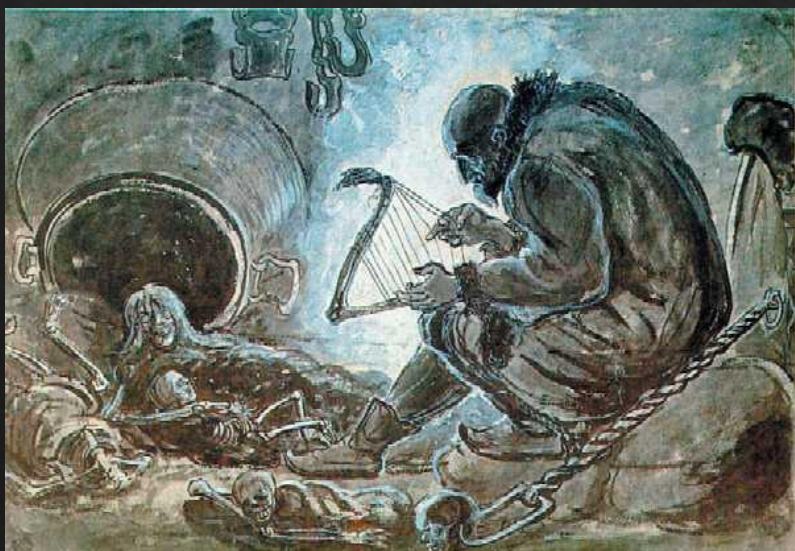
Как появился дыуудас танон фандыр