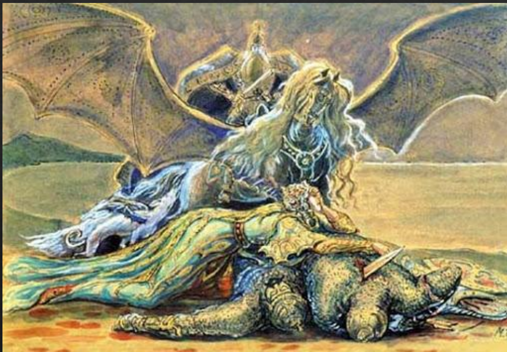
Смерть Ахсара и Ахсартага