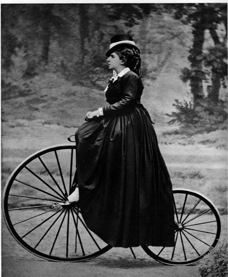
Schwarz: Amazon. 1895

в конце XIX - начале XX века причиной многих серьезных аварий на дорогах становились длинные юбки первых велосипедисток.