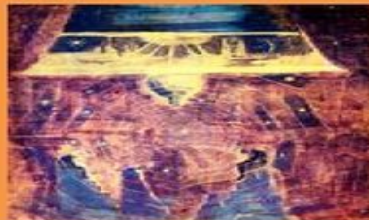
«Соната Солнца. Финал»