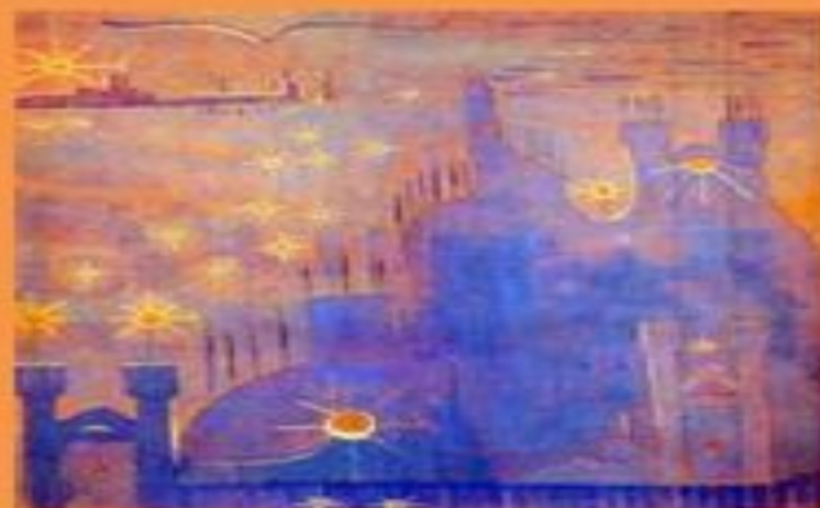
«Соната Солнца. Аллегро»