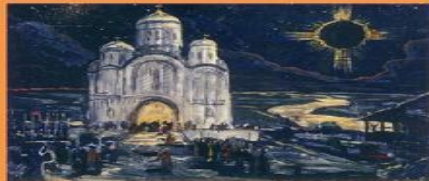
Сцена солнечного затмения.