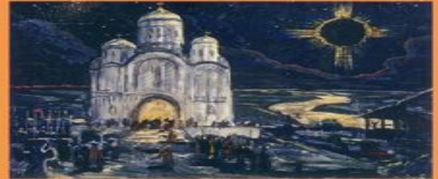
Сцена солнечного затмения.