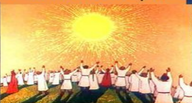
Хвалебная песнь Яриле: "Свет и сила, бог Ярило"