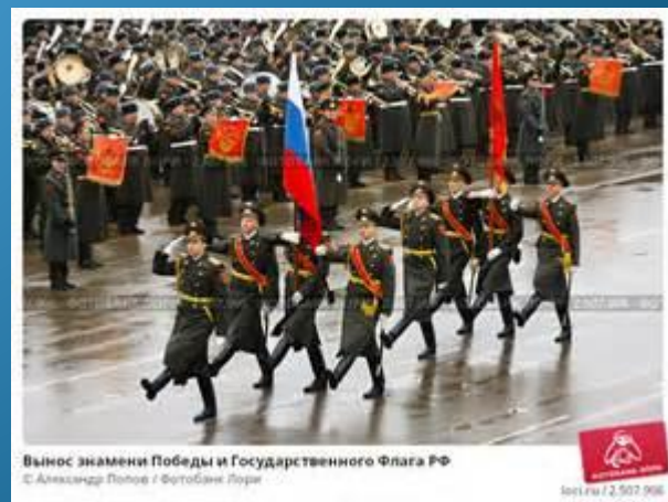
Вынос знамени Победы и Государственного Флага РФ