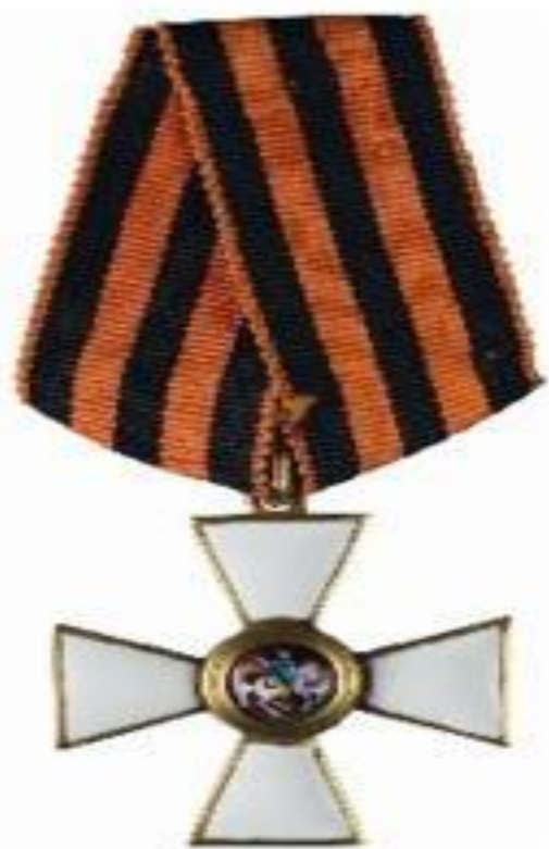
КАВАЛЕРОВ ОРДЕНА СВЯТОГО ГЕОРГИЯ