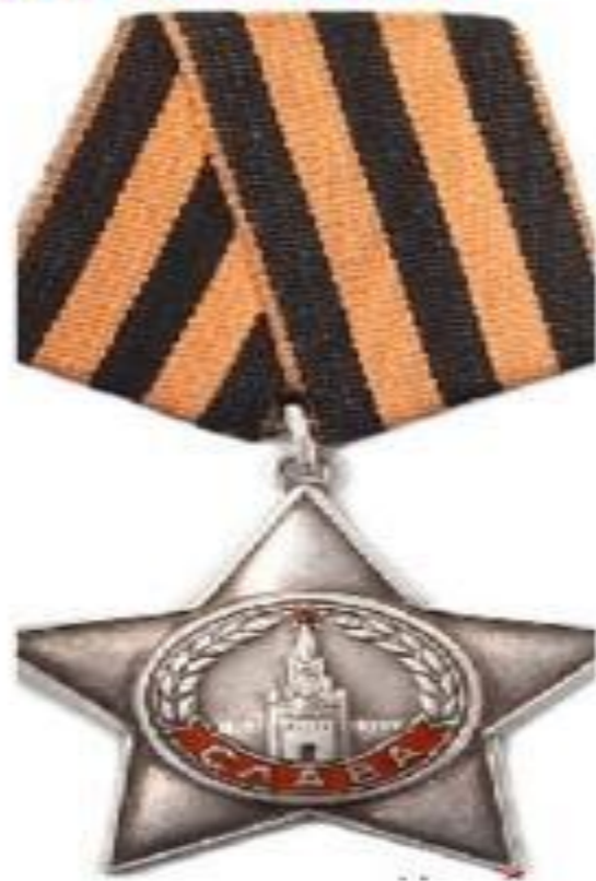
КАВАЛЕРОВ ОРДЕНА СЛАВЫ