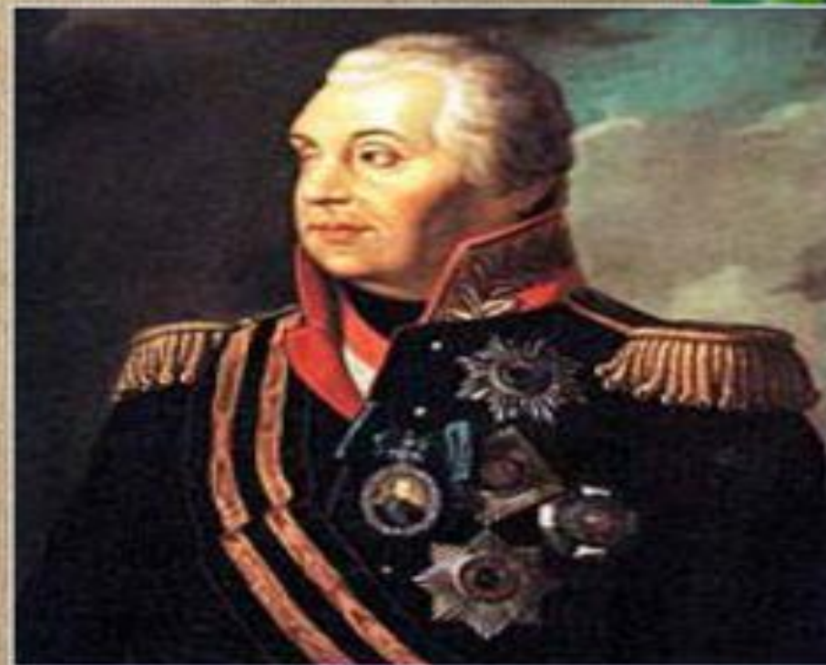
М. И. Кутузов. Художник Н. Яш. 1883.

Битва с Наполеоном - Бородинское сражение