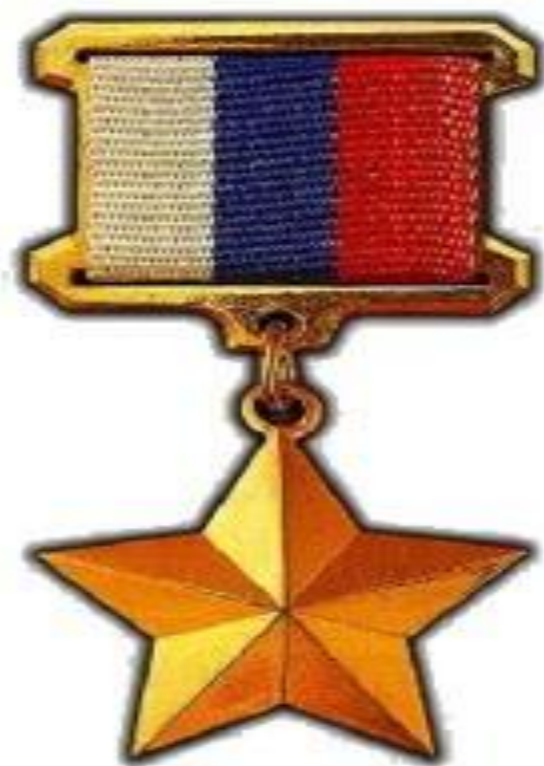
ГЕРОЕВ РОССИЙСКОЙ ФЕДЕРАЦИИ