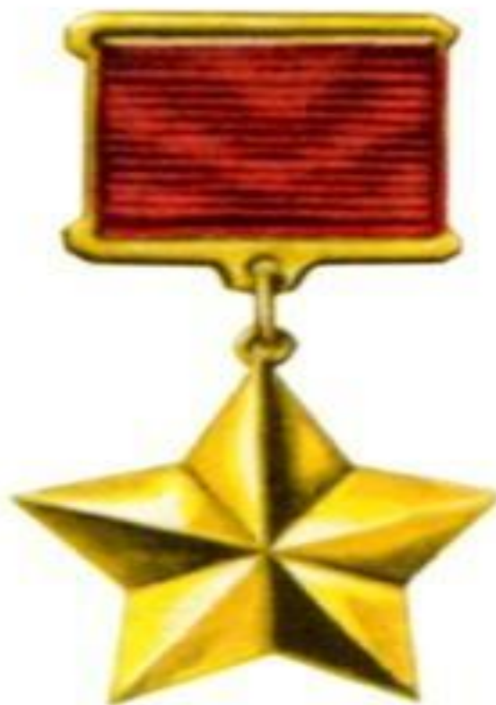
ГЕРОЕВ СОВЕТСКОГО СОЮЗА